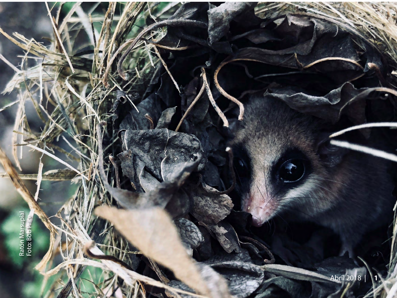
Ratón Marsupial