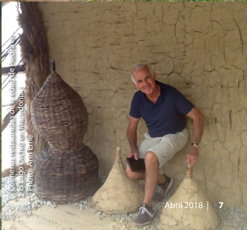
Colmenas restauradas de la edad de Piedra en el Lago Orchid en Macedonia.