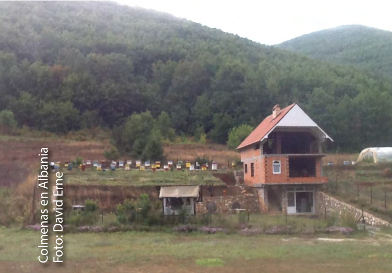
Colmenas en Albania