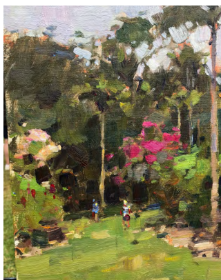
Obra original en óleo. Pintada en sitio, en el Jardín Botánico de Vallarta por Jim McVicker, artista/instructor en Casa de los Artistas www.ArtWorkshopVacations.com