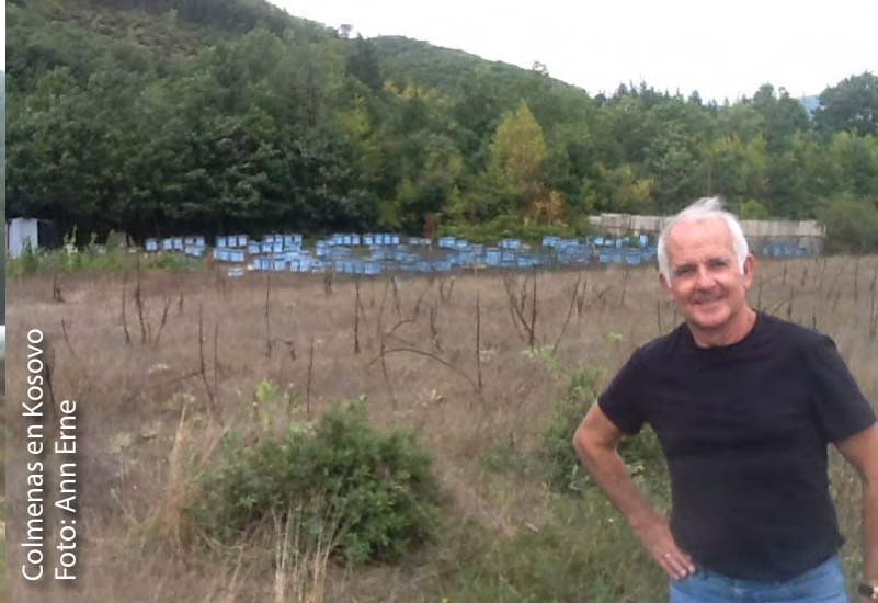
Colmenas en Kosovo