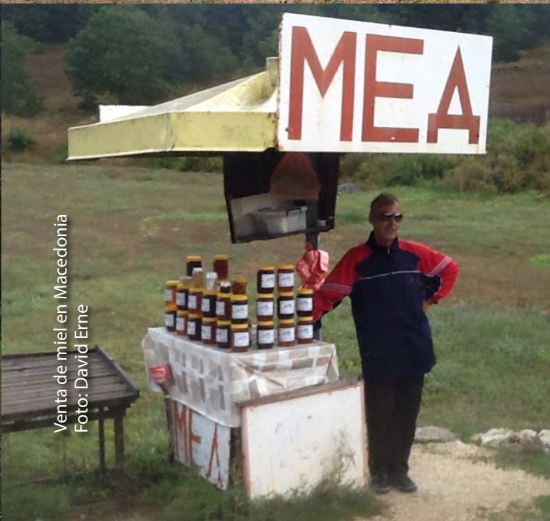
Venta de miel en Macedonia

Shakespeare, William. 1600. Henry V, Acto 1, Escena 2