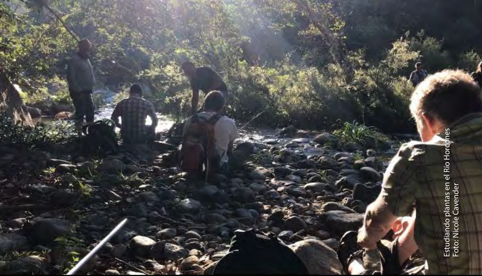
Estudiando plantas en el Río Horcones