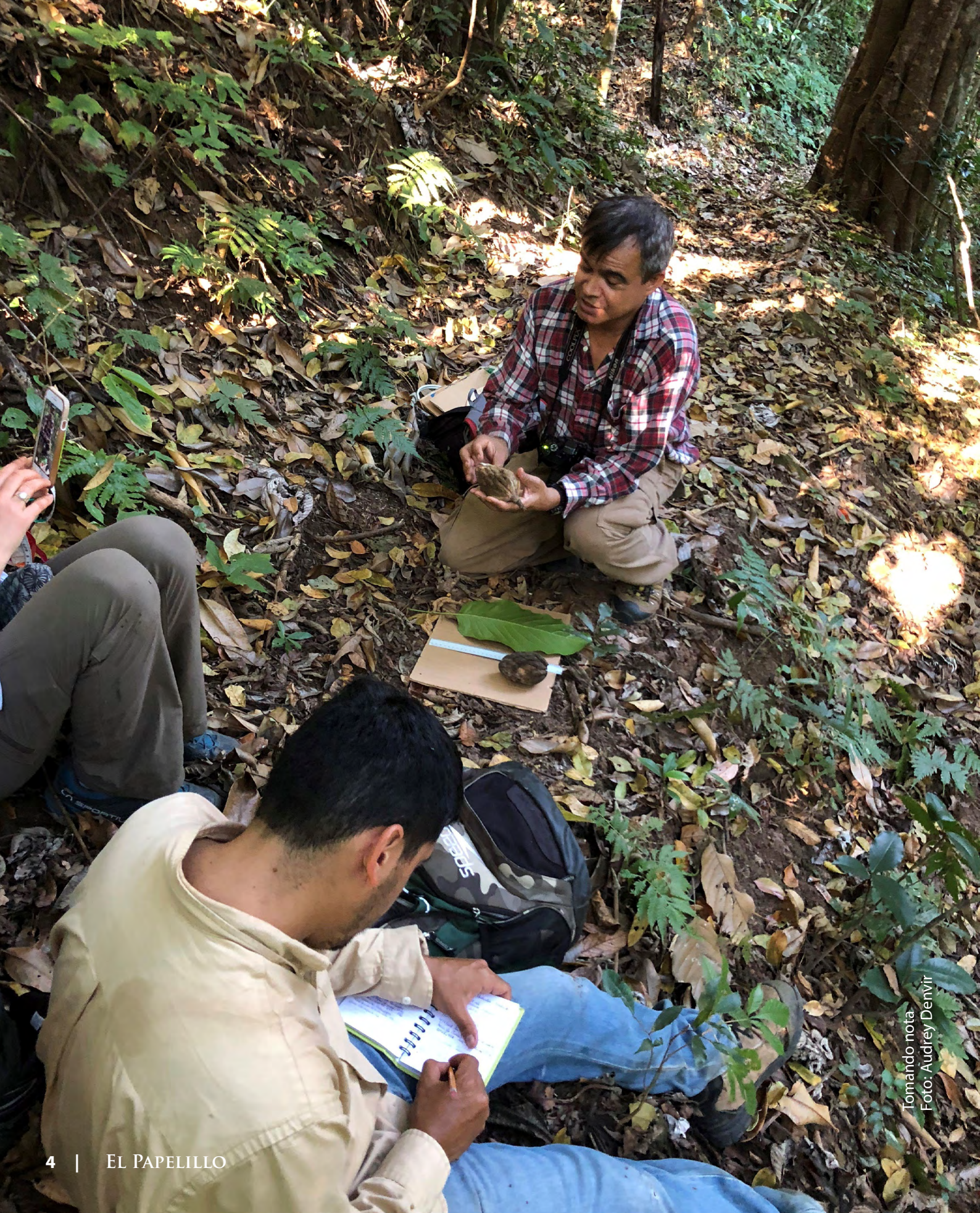
Tomando nota.