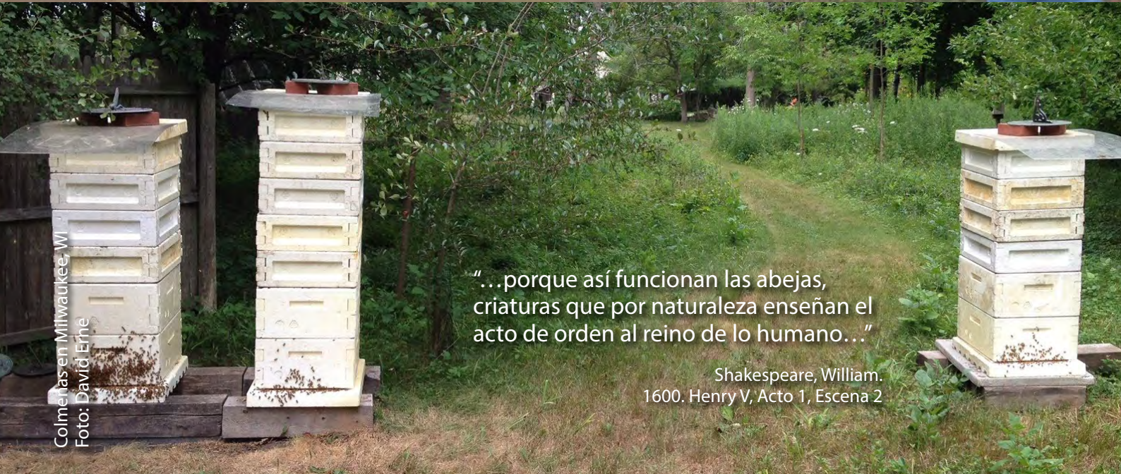
Colmenas en Milwaukee, WI

"...porque así funcionan las abejas, criaturas que por naturaleza enseñan el acto de orden al reino de lo humano..."