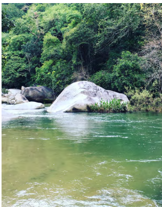
Portada: Río Horcones