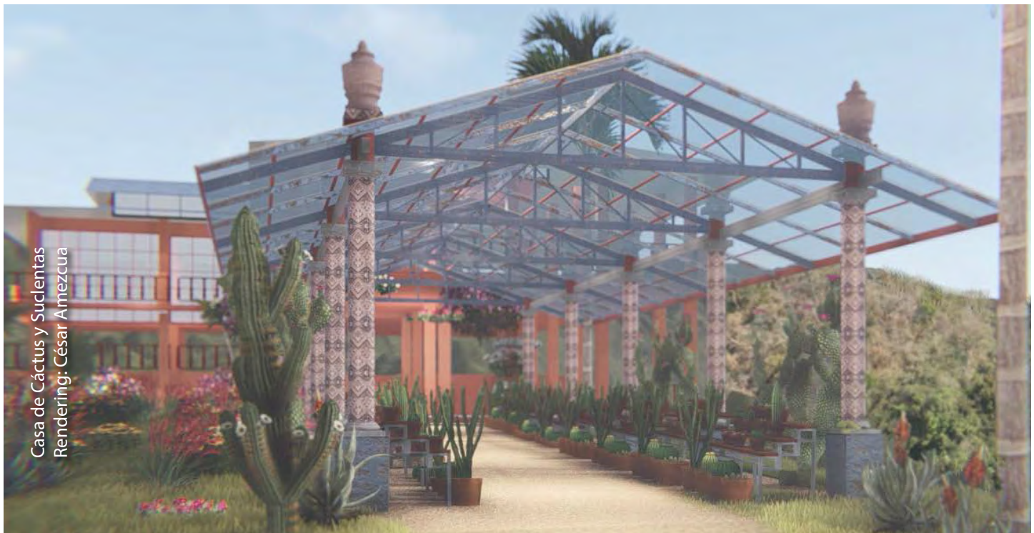
Casa de Cactus y Suculentas Rendering: César Amezcua