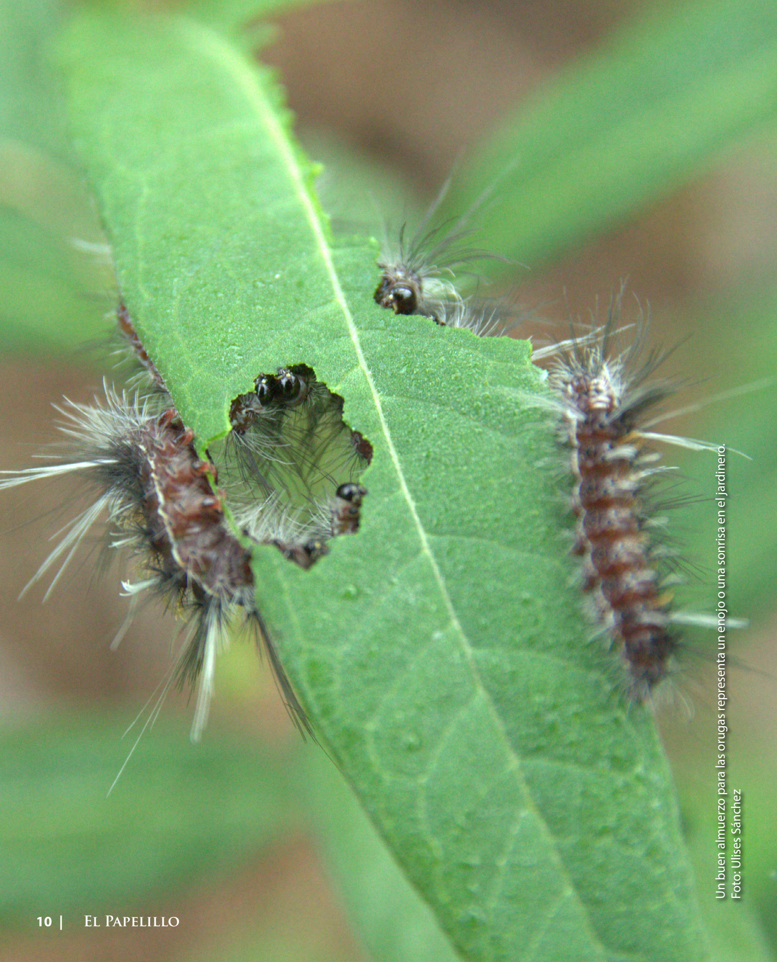
Un buen almuerzo para las orugas representa un enojo o una sonrisa en el jardinero.