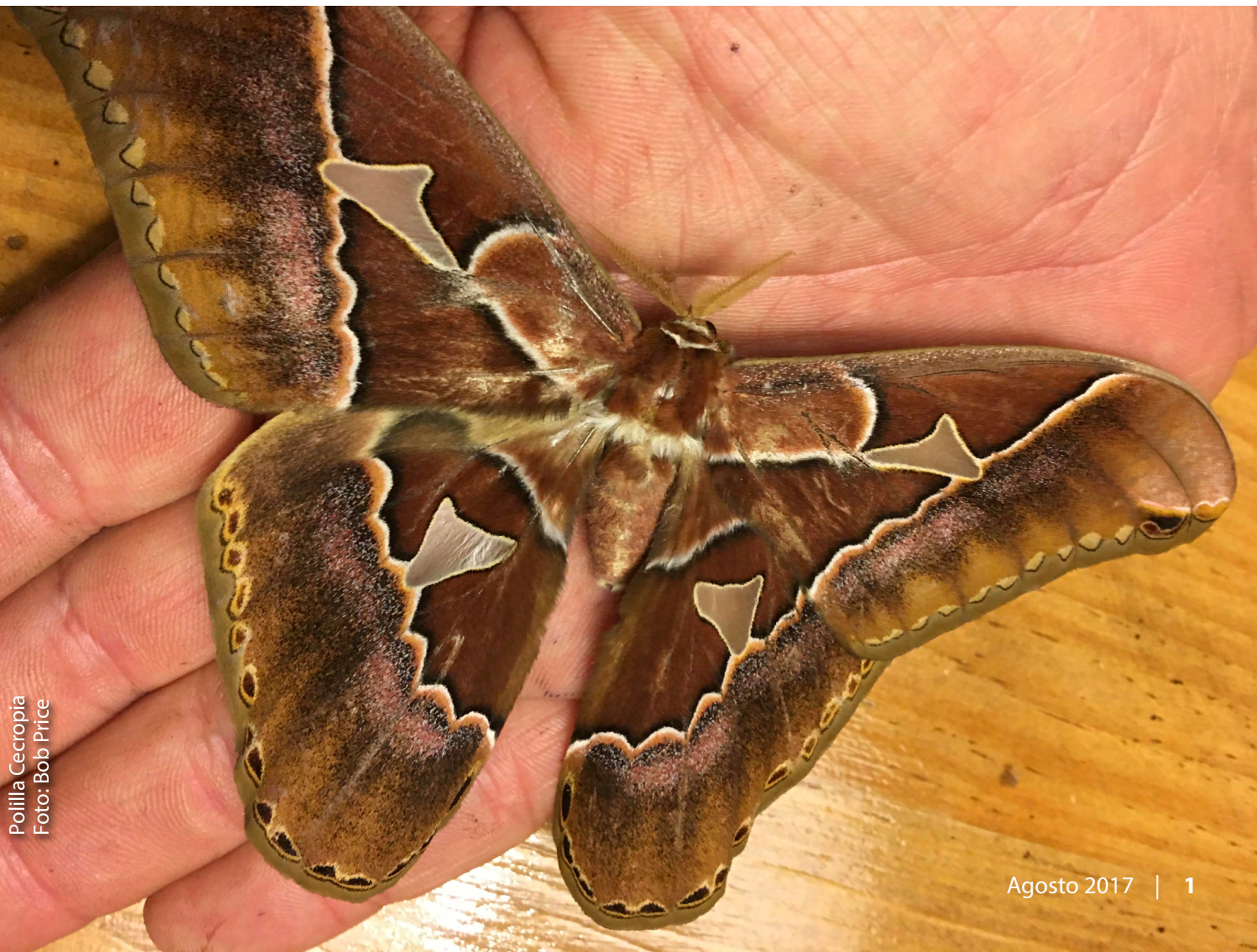
Polilla Cecropia