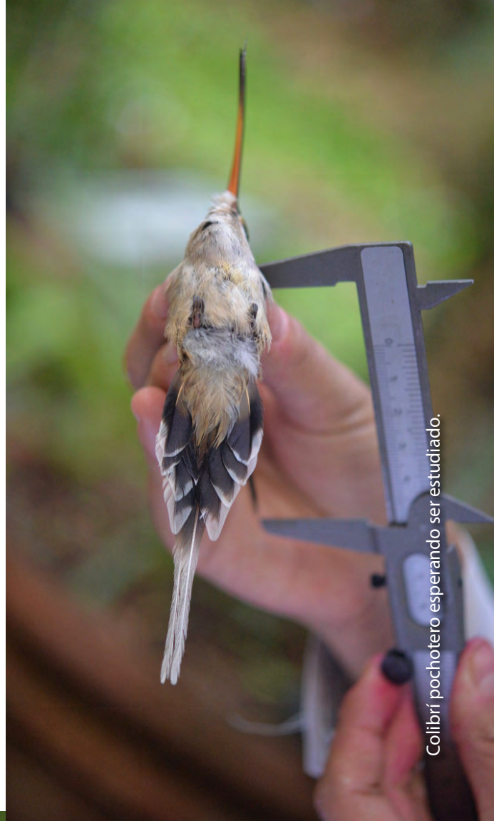
Colibrí pochotero esperando ser estudiado.

Estas colaboraciones con investigadores y la UNAM, ayudan a continuar creando nuevos conocimientos sobre la biodiversidad mexicana y para la educación ambiental.