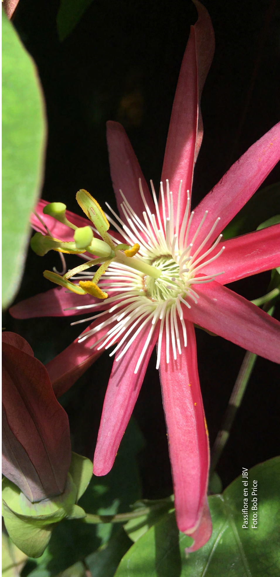
Passiflora en el JBV

Incluir al Jardín Botánico de Vallarta en tu testamento, fideicomiso e inversiones, representa, en el largo plazo, la viabilidad de que este importante santuario natural de Puerto Vallarta, lleno de exquisita flora de México y trópicos del mundo, siga viviendo. Uno de los miembros del Comité del Legado del Jardín estará encantado de compartir las mejores opciones para optimizar tu potencial filantrópico y bendecir aún más a la comunidad. Por favor, escribe a info@vbgardens.org .