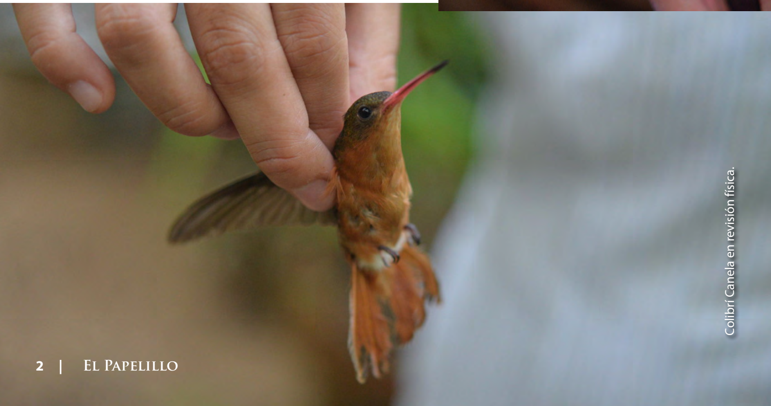
Colibrí Canela en revisión física.