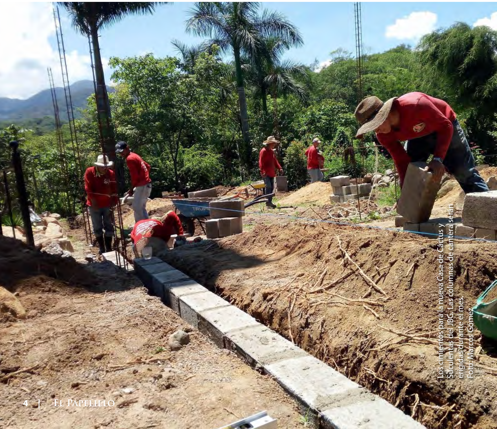
Los cimientos para la nueva Casa de Cactus y Suculentas del JBG. Las columnas de cantera serán erigidas durante el mes

Te invitamos a ser parte de los primeros contribuyentes visionarios del Proyecto de Cactus y Suculentas. Tu donativo, deducible de impuestos, creará un legado de cultivo y exhibición de cactus y suculentas en el Jardín Botánico de Vallarta. Juntos construiremos un impactante atractivo para los visitantes.