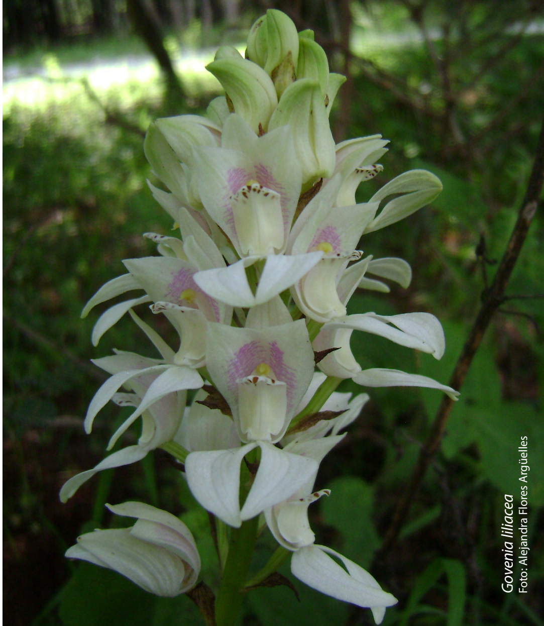
Govenia liliacea