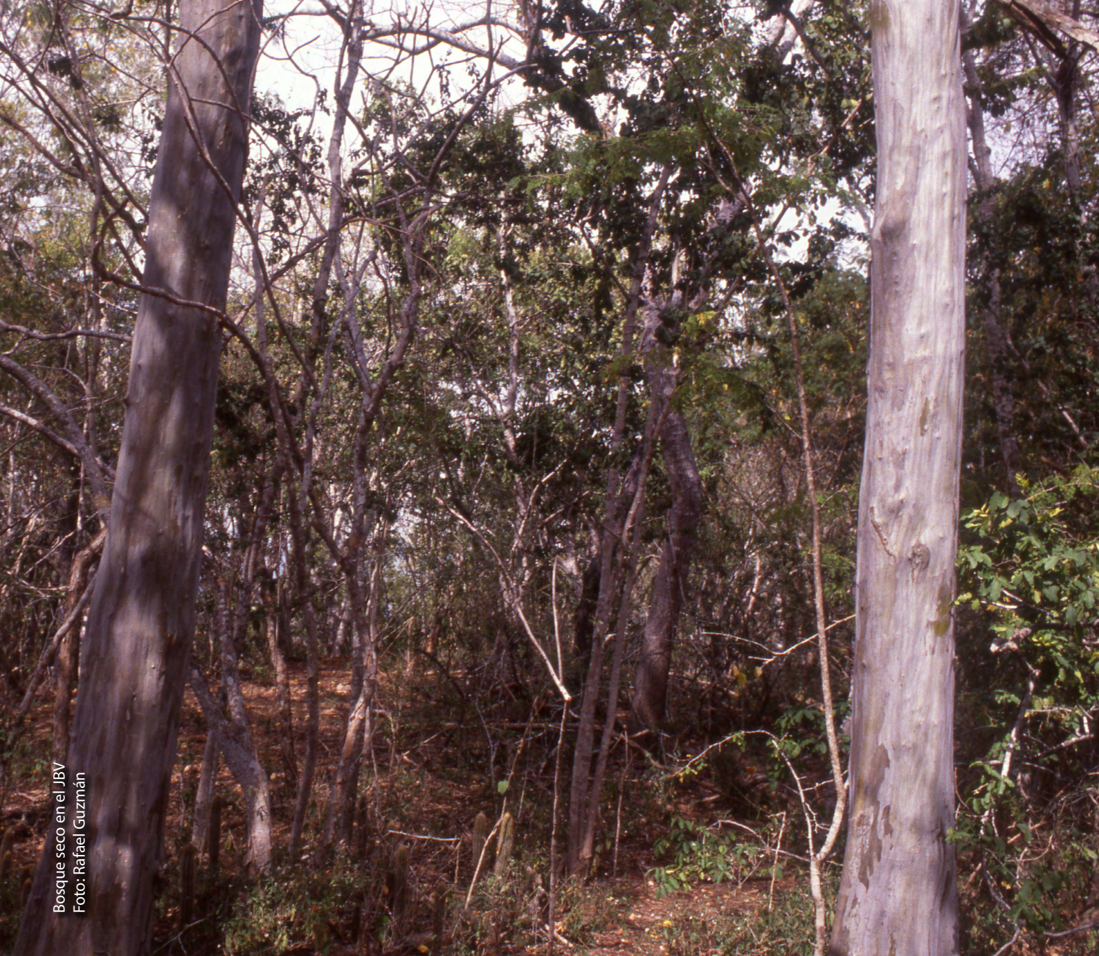
Bosque seco en el JBV

La Bahía de Banderas se encuentra, además, justo en la transición de dos grandes zonas biogeográficas. Boca de Tomates, dentro de Jalisco, está en la desembocadura del Río Ameca, ubicándose precisamente a la mitad de la transición del Eje Volcánico Transversal (corriendo de este a oeste) con la Sierra Madre del Sur.