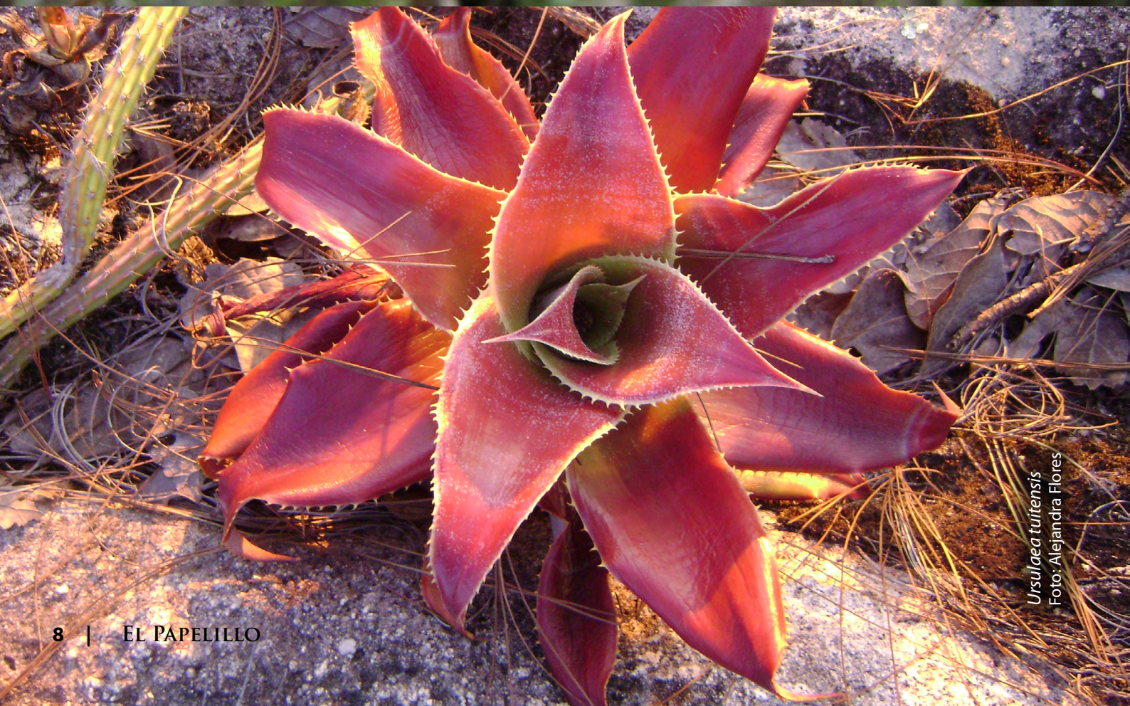
Ursulaea tuitensis