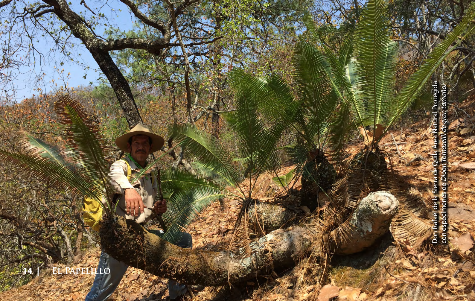
Don Rraael de la Sierra de Quila Area Natural Protegida con especímenes de Dioon tomasellii de gran tamaño.