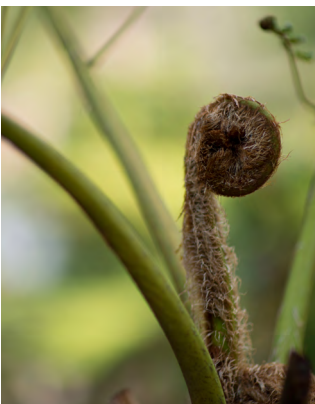
Portada: Helecho desplegándose Aaron Nace www.phlearn.com