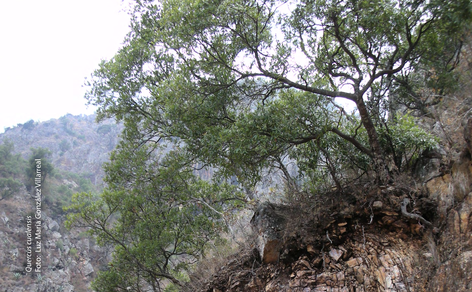
Quercus cualensis