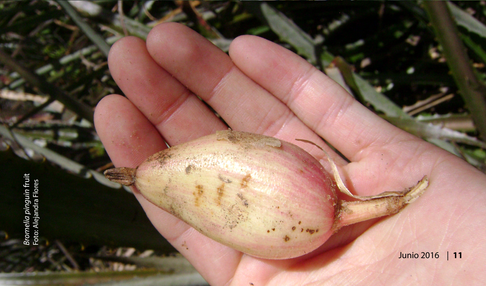
Bromelia pinguin fruit