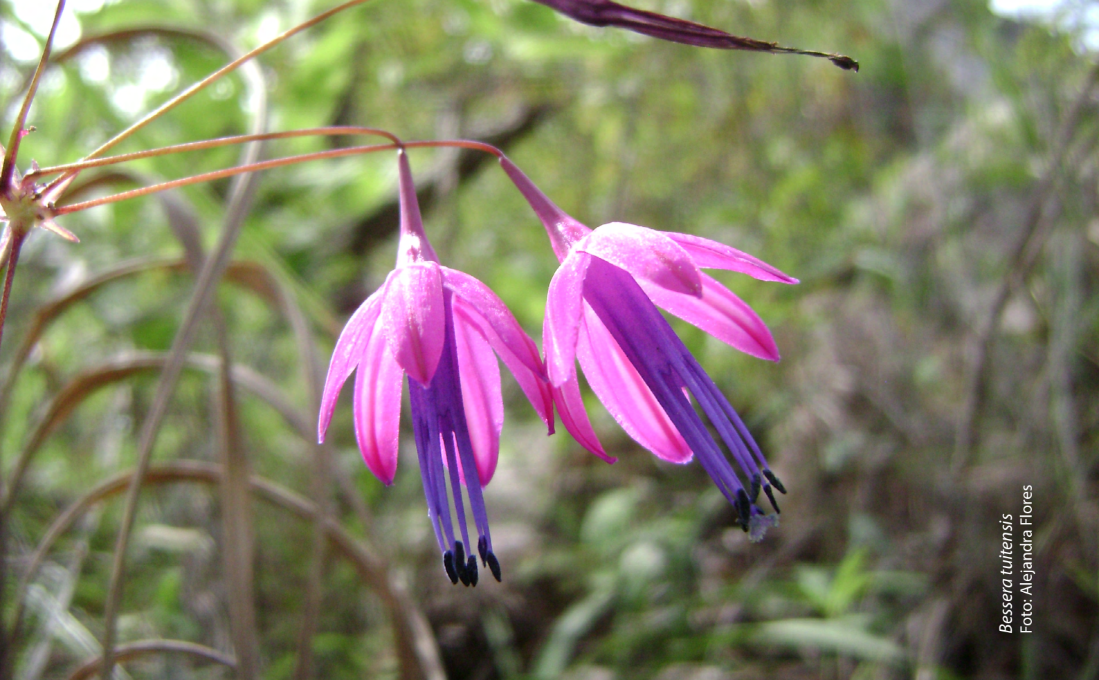
Bessera tuitensis