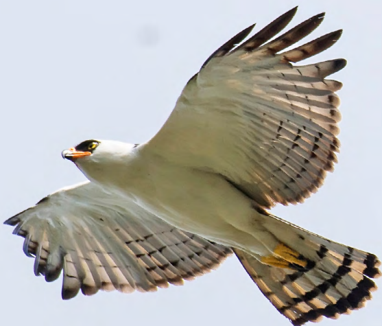
Spizaetus melanoleucus

Afortunadamente, ese día era parte del destino del Sr. Gordon -quien es un excelente pajarero-. Fue su primera visita e hizo historia. Entre las aves que vio, fotografió y compartió en su blog, TheCanadianWarbler.blogspot , se encontraba una misteriosa ave rapaz volando directamente sobre el Jardín, “contra el cielo azul cobalto, ¡en una parvada de zopilotes y halcones!”