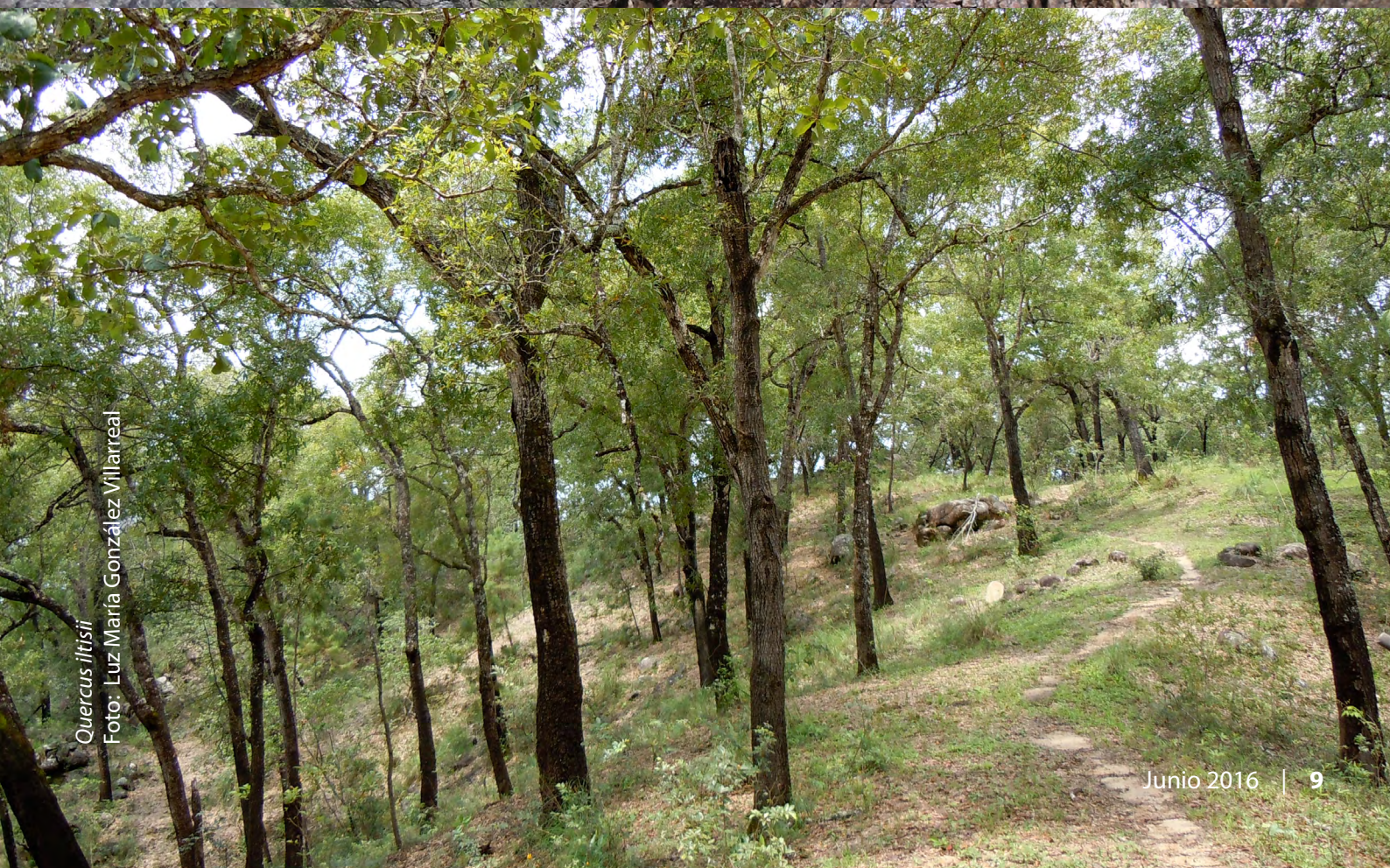
Quercus iltisii