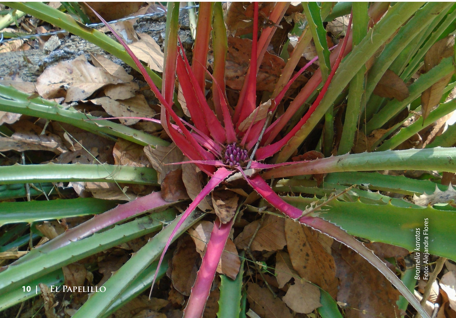
Bromelia karatas

En la Bahía de Banderas contamos con un sin número de especies con algún uso benéfico. Aprender estos usos no sólo nos ayuda a mejorar nuestra calidad de vida, sino también a apreciar y a conservar los recursos naturales.