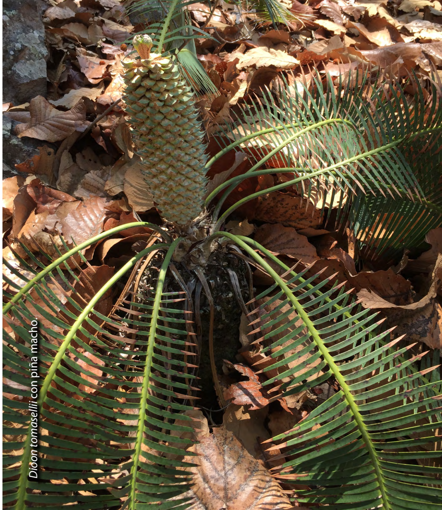
Dioon tomaselli con piña macho.

Las poblaciones de cícadas que permanecieron se encuentran en regiones tropicales y subtropicales alrededor del mundo, aunque siguen desapareciendo. Algunas especies han quedado extintas en la modernidad y muchas otrashandisminuidoapoblacionestanpequeñas que son de alta preocupación. Las colecciones de cícadas ex-situ en jardines botánicos pueden ser de gran ayuda a la conservación de especies que de otra forma desaparecerían. Comprender la vida de las cícadas en su entorno natural es el primer paso para su protección. Aún queda mucho por conocer de Dioon tomaselli , como la identificación de sus polinizadores y agentes de dispersión, así como comprender extensamente su distribución y actual diversidad genética y variaciones morfológicas. Contribuir con la investigación para responder algunas de las preguntas puede guiar a una aproximación más profunda y estratégica para la conservación de las cícadas. El JBV agradece a las autoridades ambientales, a niveles federal y estatal, por permitir este proyecto, así como a las oficinas locales y a los colaboradores. Compartiremos los reconocimientos detallados cuando los resultados de la investigación sean publicados.