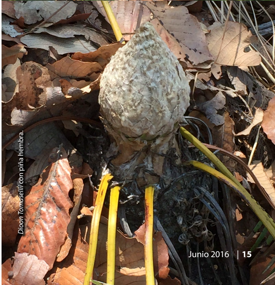
Dioon tomaselli con piña hembra.