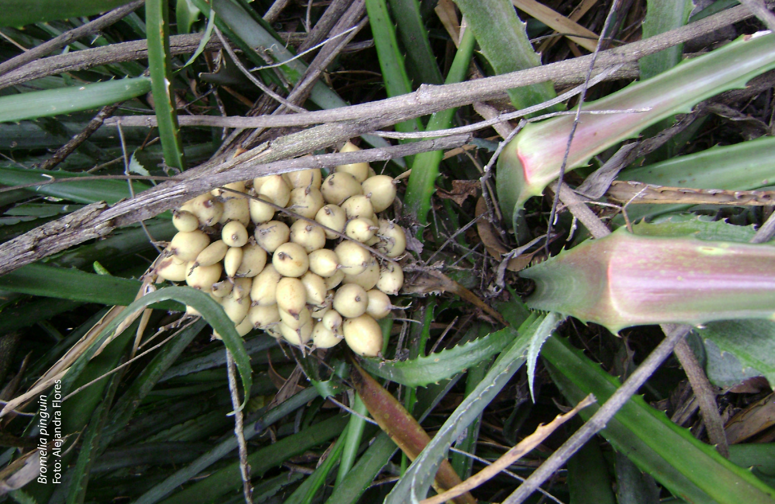
Bromelia pinguin