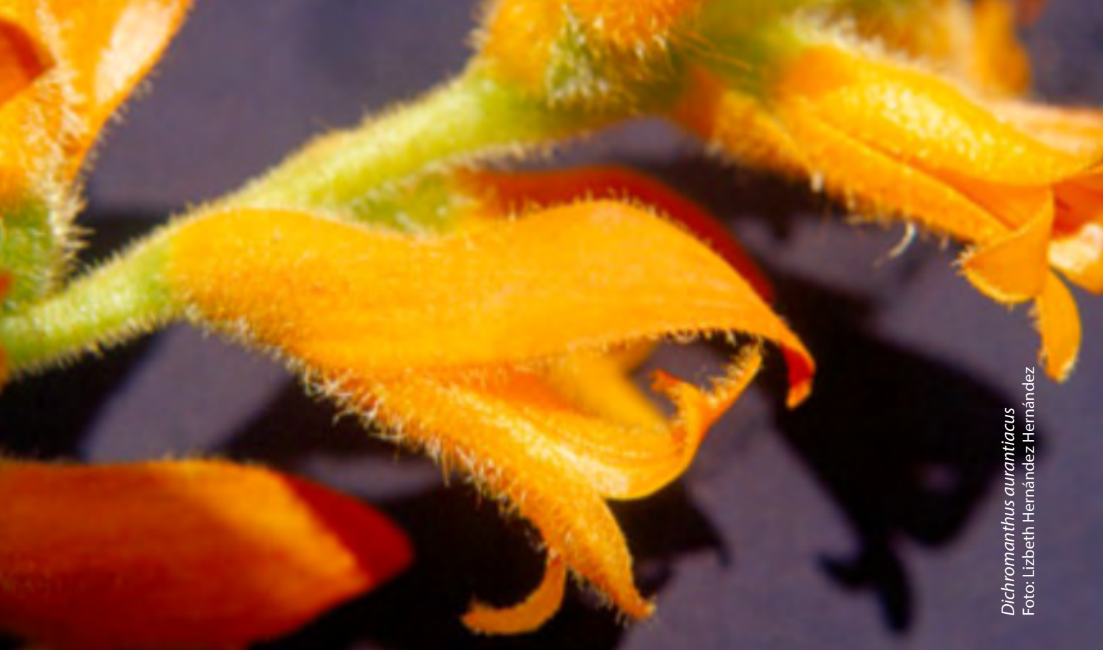
Dichromanthus aurantiacus