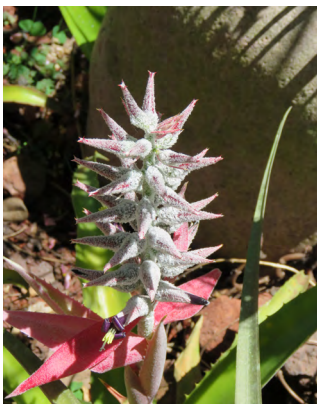
Cover: Mike Laking Ursulaea tuitensis