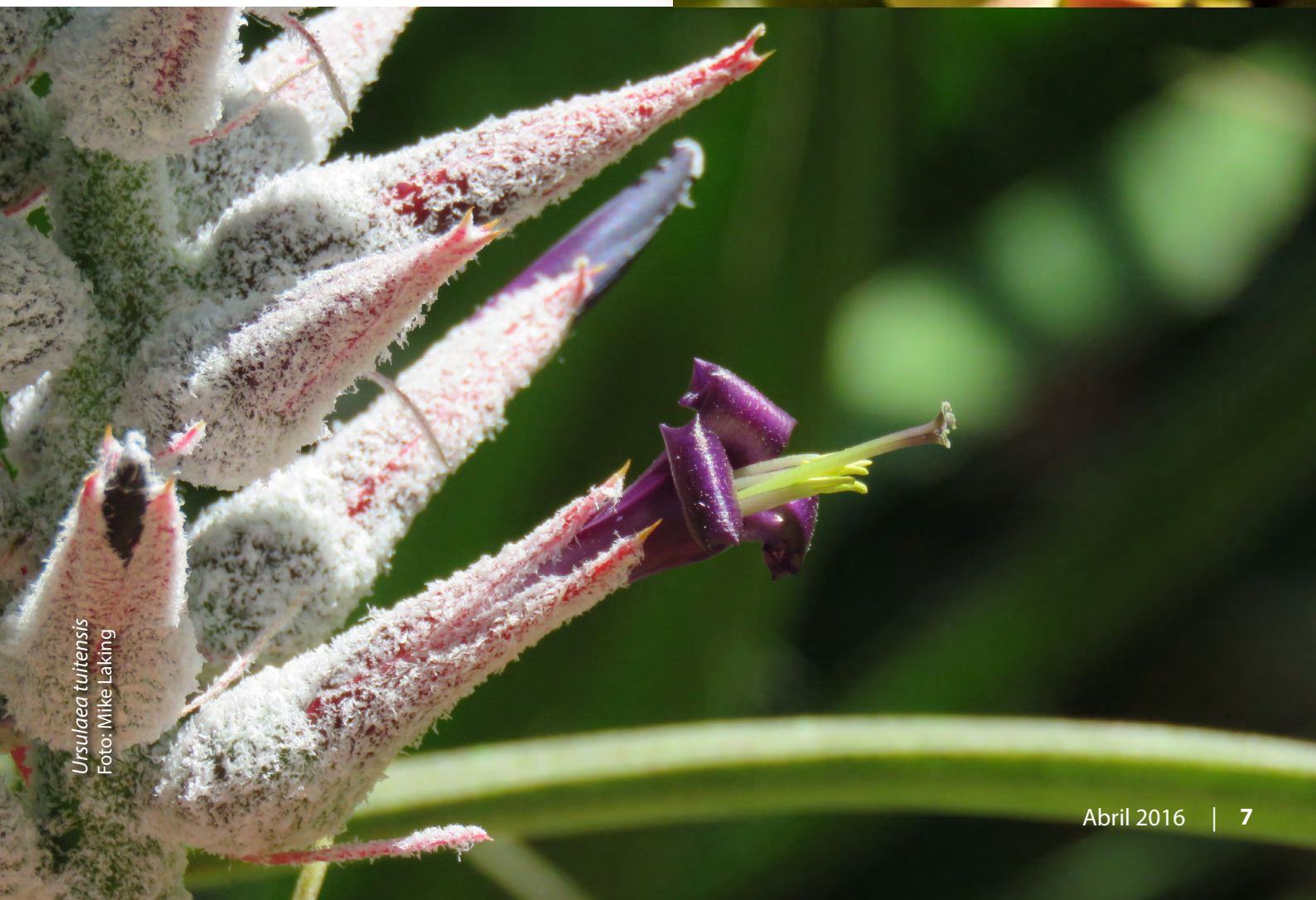
Ursulaea tuitensis