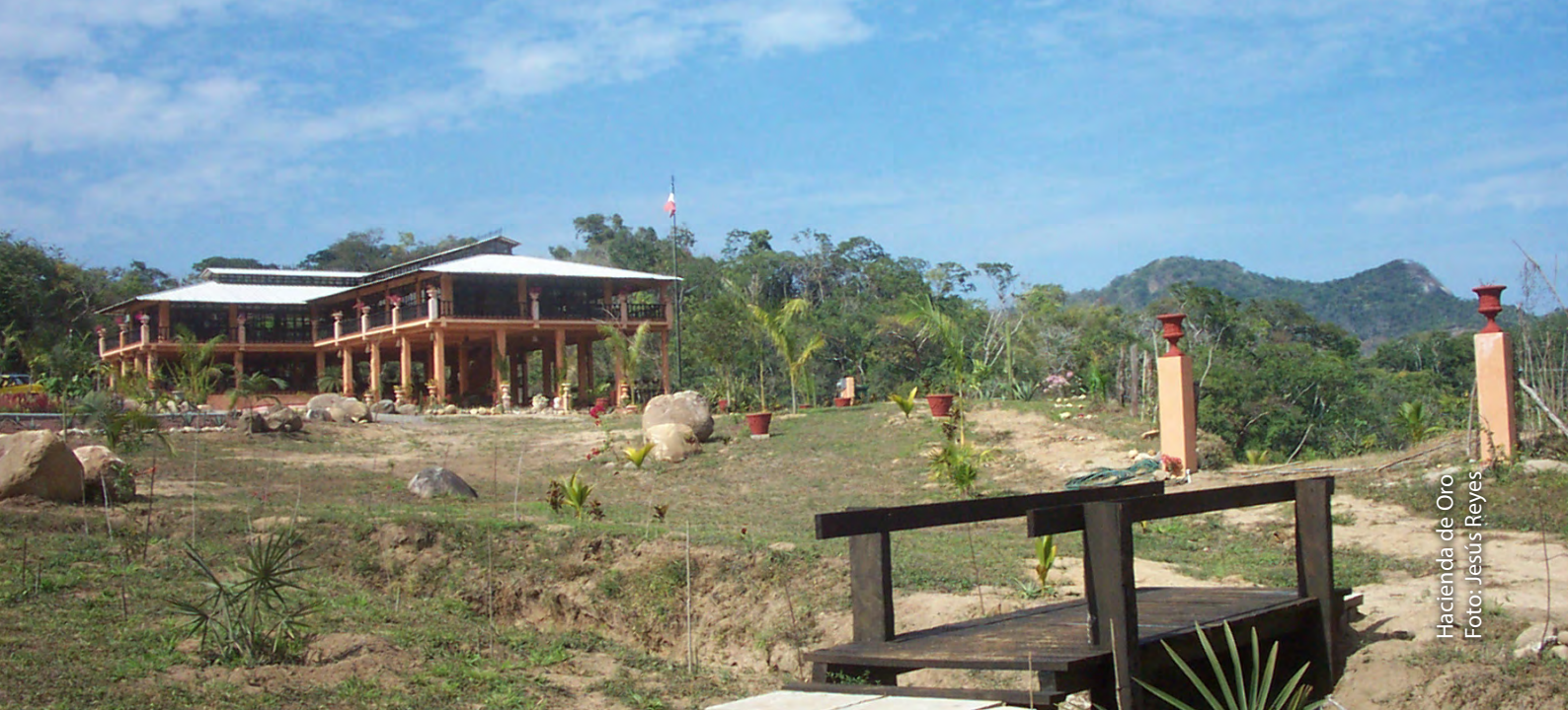
Hacienda de Oro