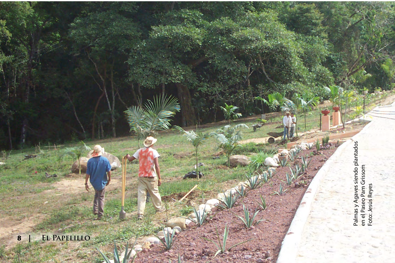
Palmas y Agaves siendo plantados en el Paseo Pam Grissom