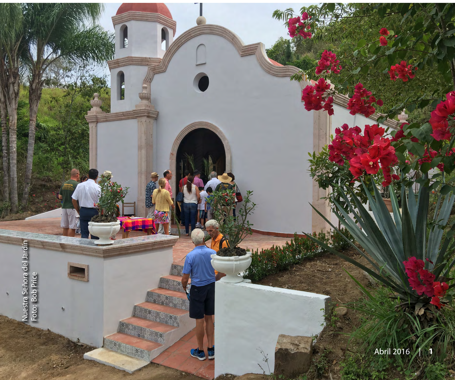
Nuestra Señora del Jardín