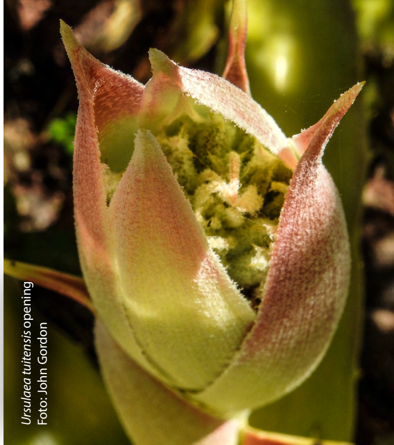
Ursulaea tuitensis opening

Ambas plantas son hermosas y una adición valiosa para cualquier jardín. Cuando el origen de sus nombres es conocido y los conecta a apasionados de la flora, la planta se torna aún más interesante.