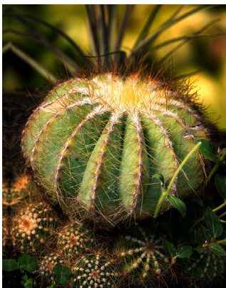
Portada: Parodia magnifica