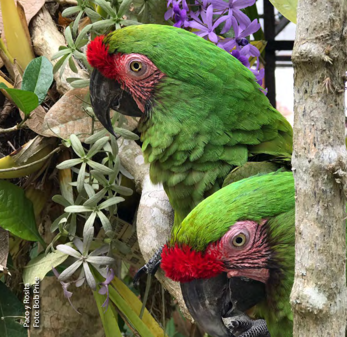
Paco y Rosita