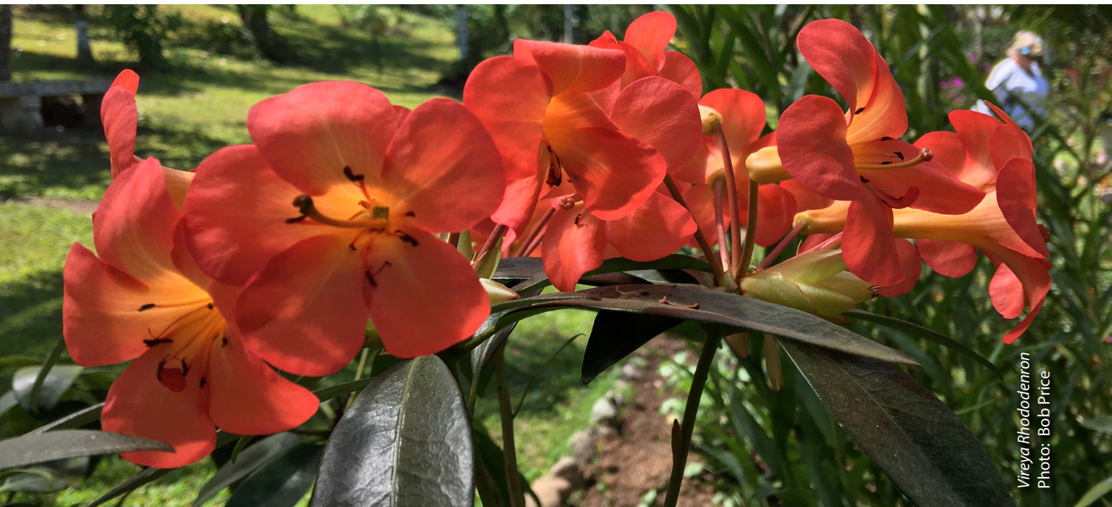
Vireya Rhododendron

*Algunas actividades están sujetas a cambio. El calendario más actualizado vinculado con links con información de futuros eventos, puedes verlo en www.vbgardens.org/calendar .