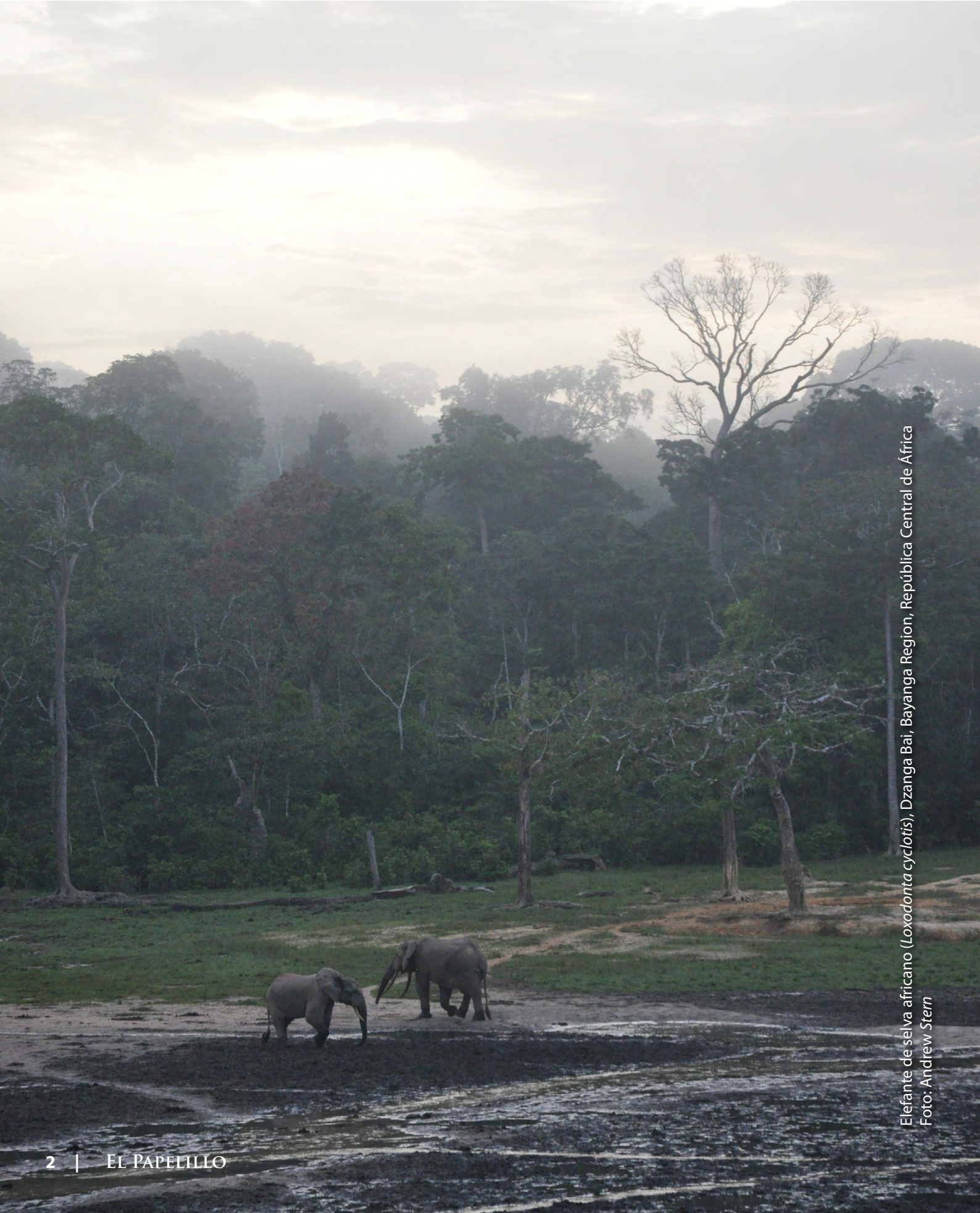
Elefante de selva africano ( Loxodonta cyclotis ), Dzanga Bai, Bayanga Region, República Central de África