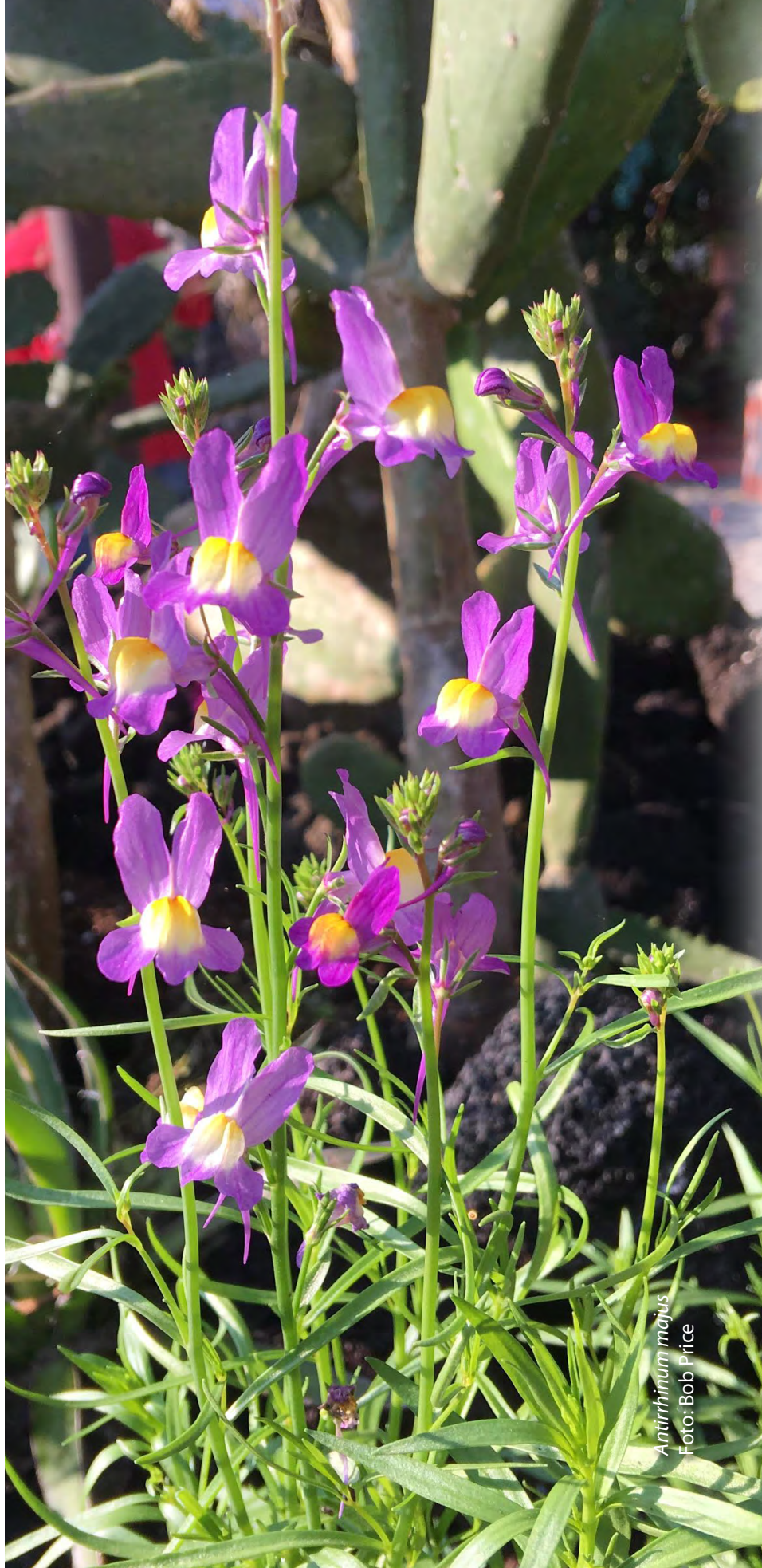
Antirrhinum majus

Incluir al Jardín Botánico de Vallarta en tu testamento, fideicomiso e inversiones, representa, en el largo plazo, la viabilidad de que este importante santuario natural de Puerto Vallarta, lleno de exquisita flora de México y trópicos del mundo, siga viviendo. Uno de los miembros del Comité del Legado del Jardín estará encantado de compartir las mejores opciones para optimizar tu potencial filantrópico y bendecir aún más a la comunidad. Por favor, escribe a info@vbgardens.org .