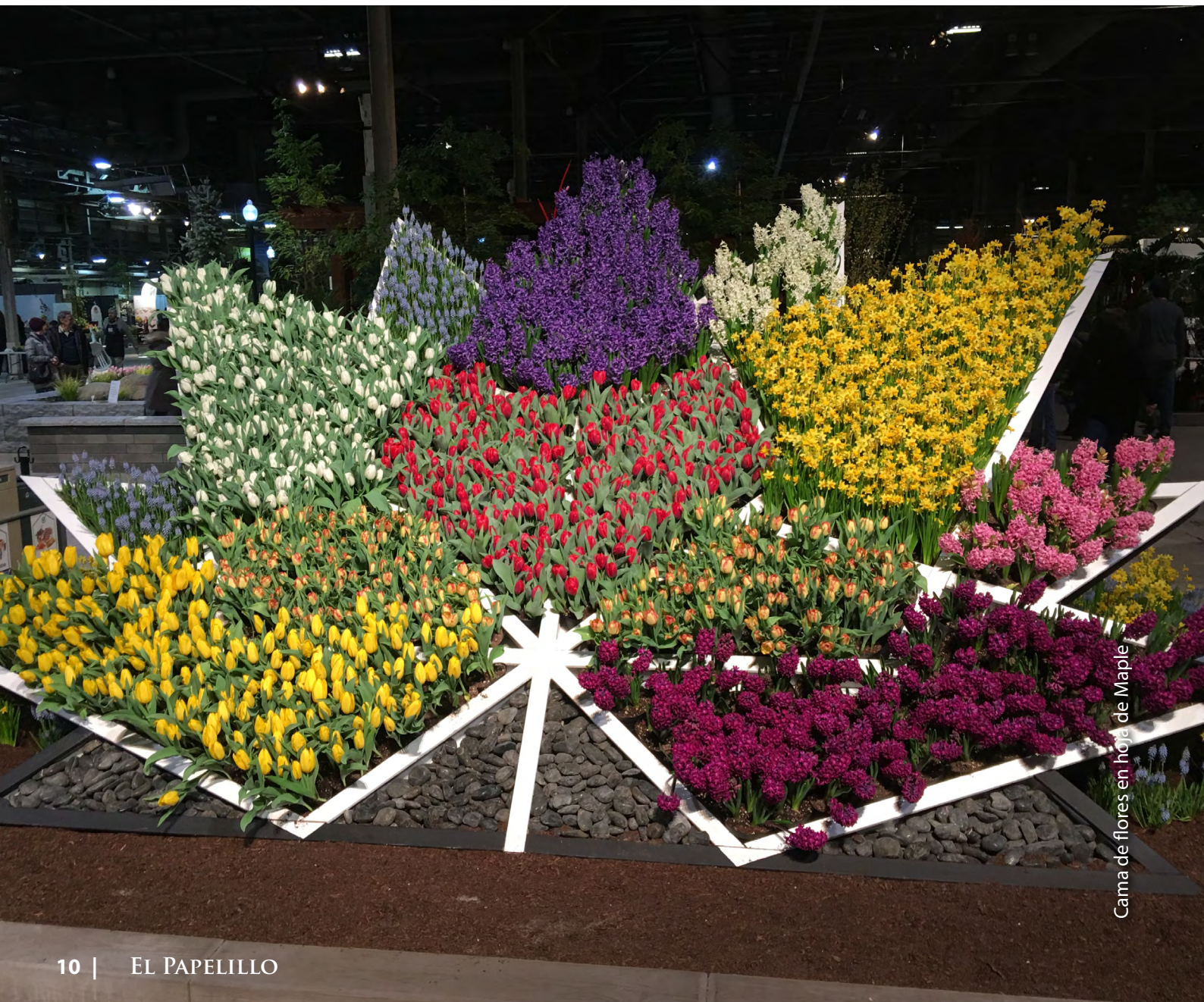
Cama de flores en hoja de Maple

El mes pasado, durante mi viaje a Toronto para la Conferencia Norteamericana de Turismo de Jardines 2017, tuve oportunidad de ir al popular Festival de Jardines y Flores Canada Blooms . Este año el tema fue “ Oh! Canadá ”, los diversos arreglos y presentaciones a lo largo de sus espacios interiores de exhibición trataban variadas interpretaciones de la historia y cultura de Canadá. El buen trabajo rindió frutos – con numerosas visitas que rompieron récord, cerca de un cuarto de millón de visitantes durante los 10 días de festival. Este flujo de asistencia es prueba positiva de que las comunidades que invierten en horticultura pública y su promoción pueden cosechar enormes recompensas.