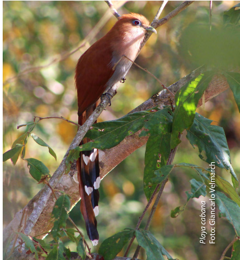
Playa cabana