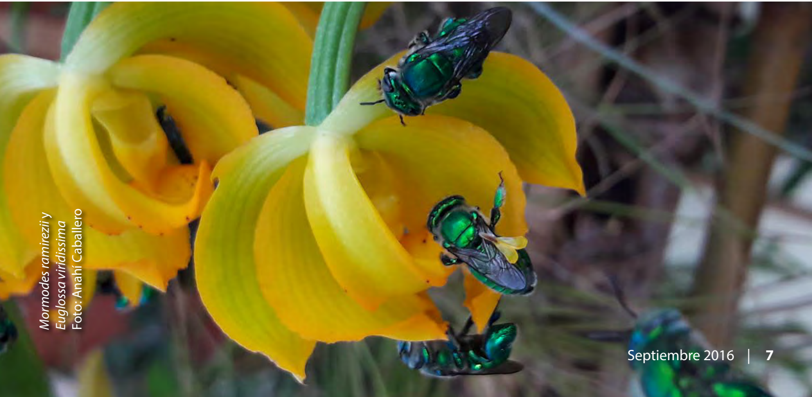
Mormodes ramirezii Euglossa viridissima