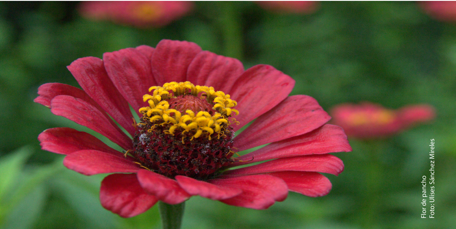
Flor de pancho

*Algunas actividades están sujetas a cambio. El calendario más actualizado vinculado con links con información de futuros eventos, puedes verlo en www.vbgardens.org/calendar .