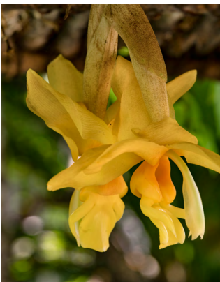
Portada: Stanhopea intermedia Mansur Kiadeh