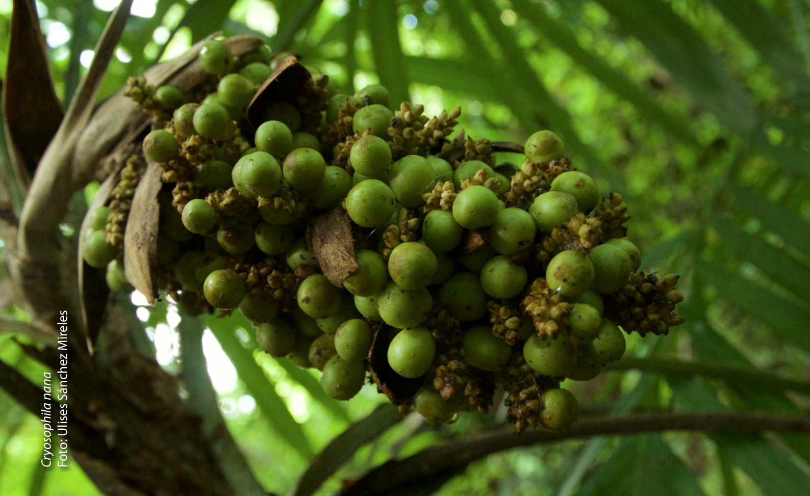
Cryosophila nana