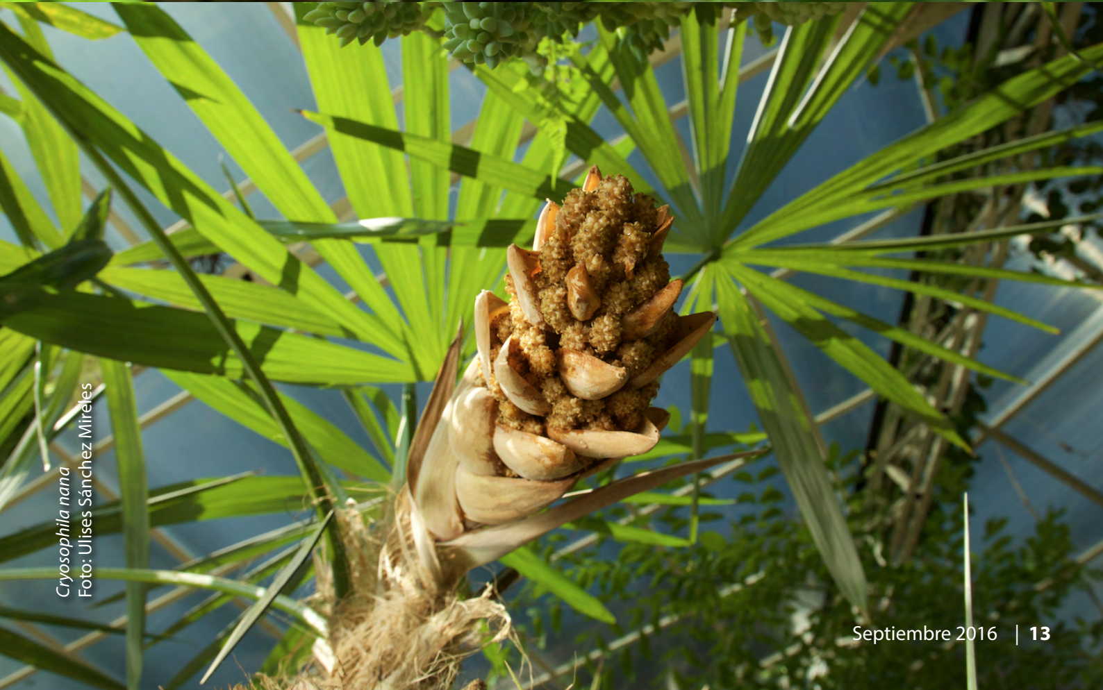
Cryosophila nana