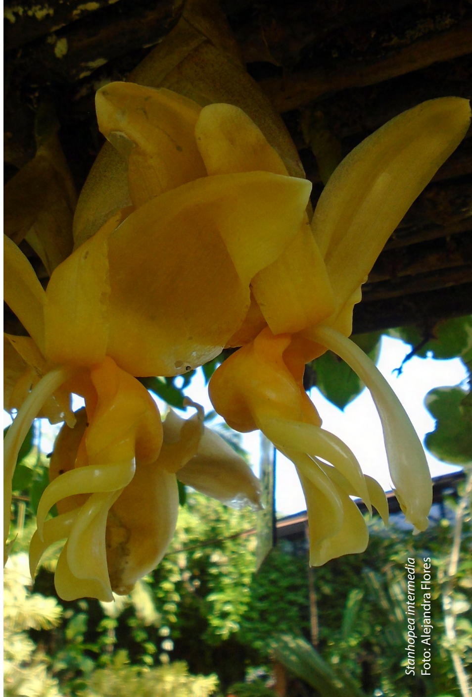
Stanhopea intermedia

Varias de estas exquisitas orquídeas se encuentran en floración en el Jardín Botánico de Vallarta, pero cada flor individual tiene un momento efímero de usualmente 24 horas. Predecir su exacto momento de floración es difícil, así que visítanos cuando puedas y, con un poco de suerte, ¡presenciarás esta maravilla botánica!