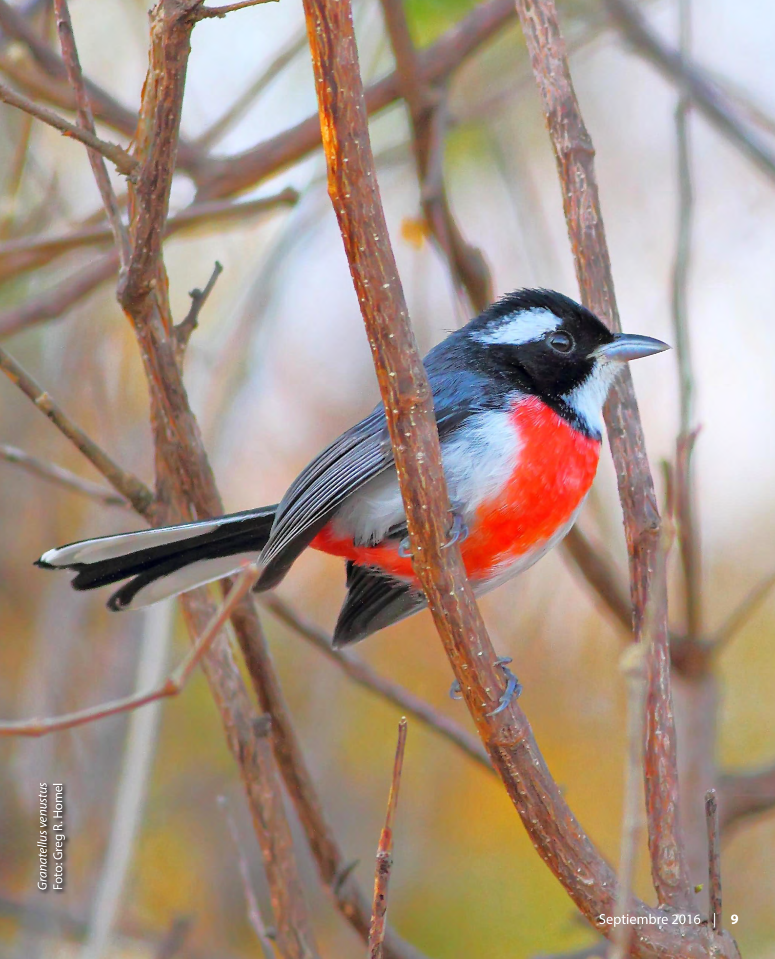
Granatellus venustus