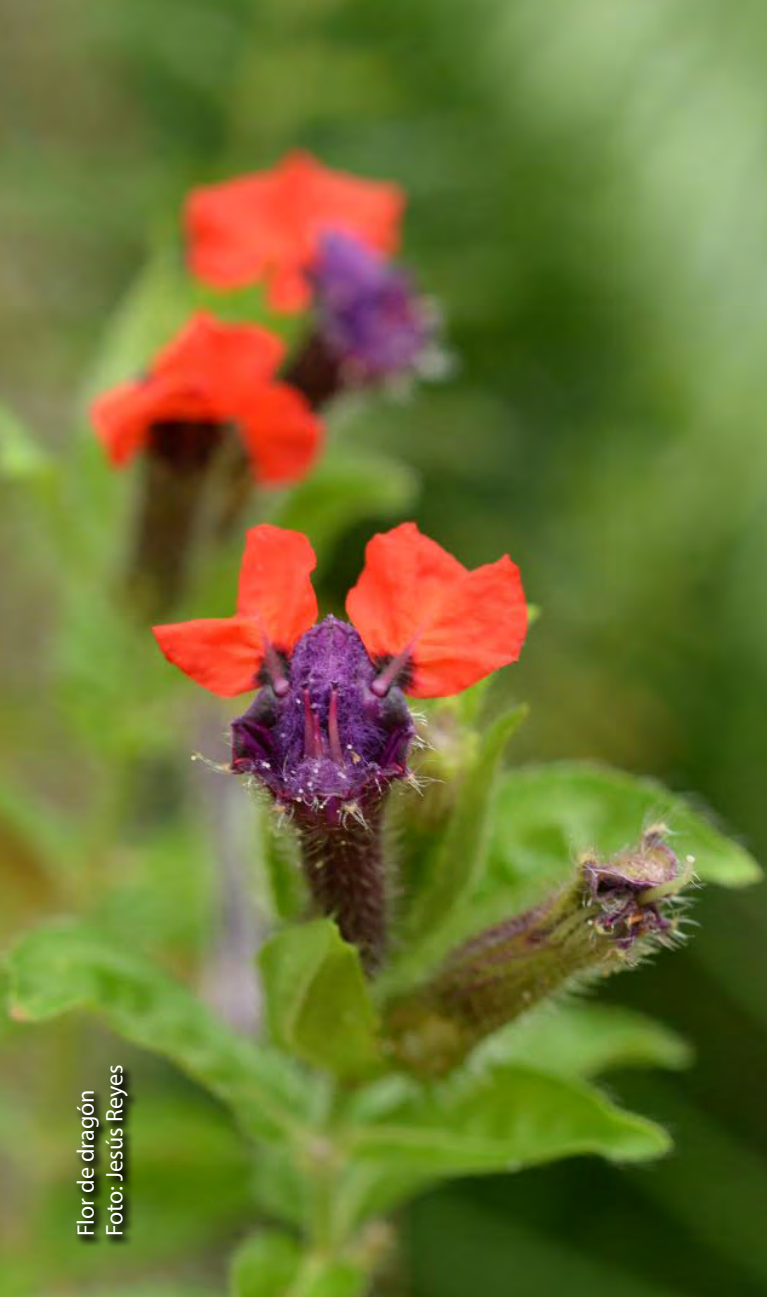
Flor de dragón