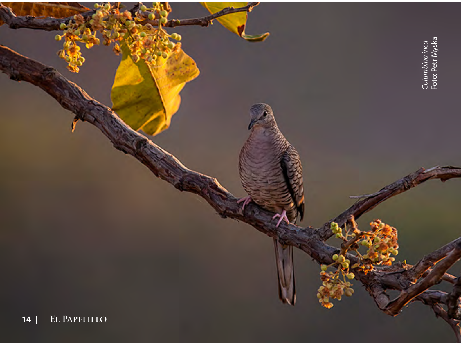
Columbiga inca

¡Visítala!... y prepárate para inspirarte.