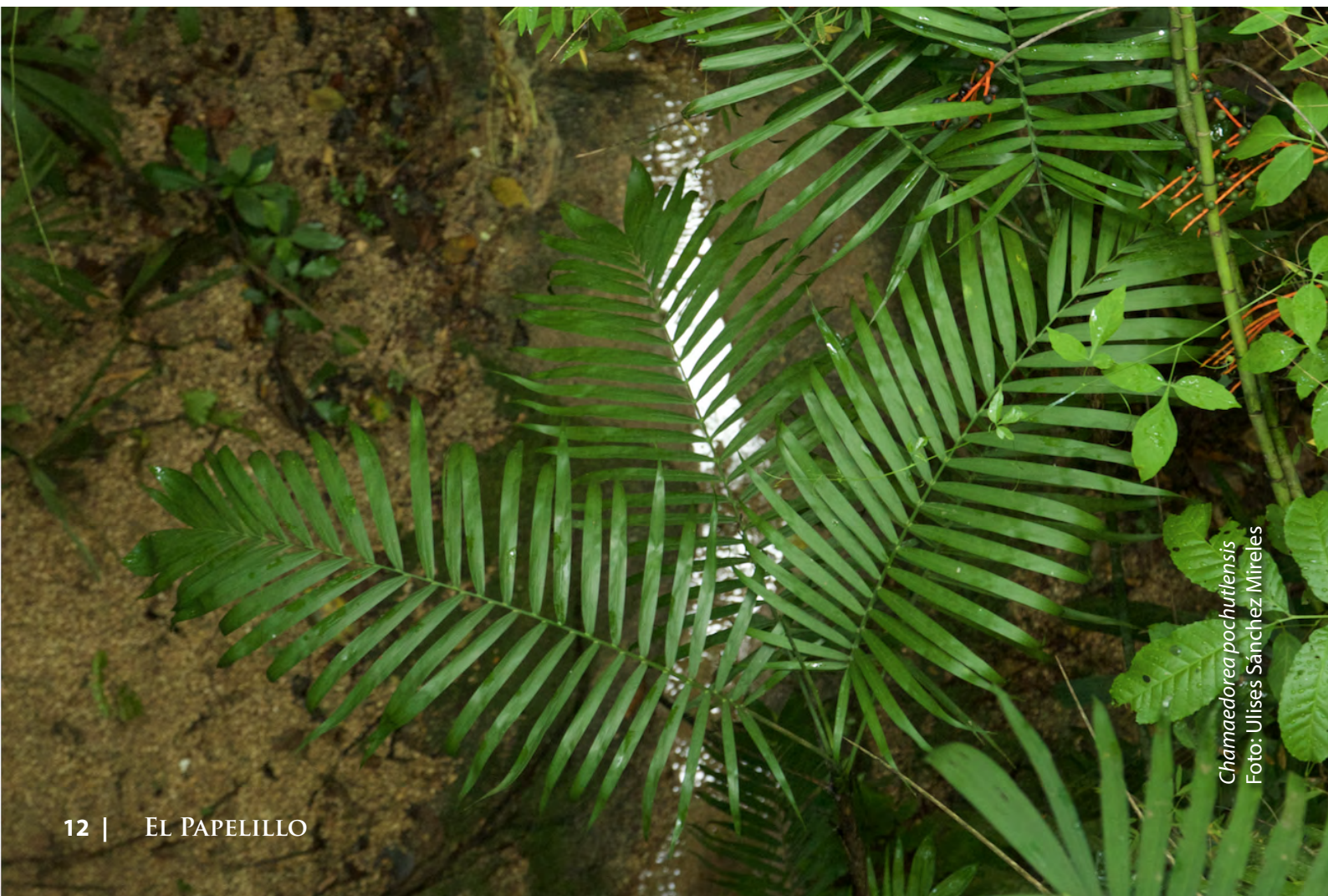
Chamaedorea pochutlensis

Conocer los diversos usos de nuestros recursos naturales es un importante paso para protegerlos. Si los aprovechamos de manera adecuada, podemos enriquecer nuestra cultura y cuidar el medio ambiente.