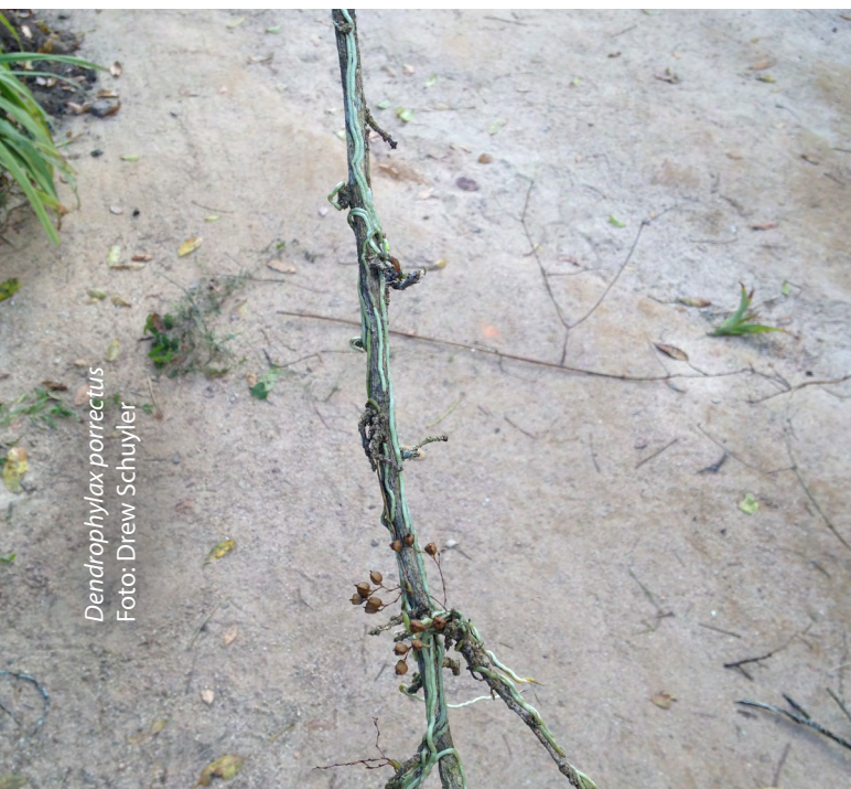
Dendrobylax porrectus