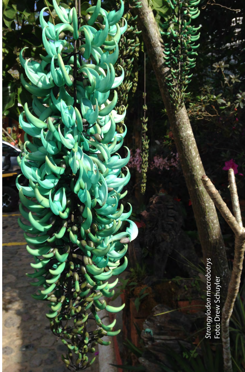
Strangylodon macrobotrys Foto: Drew Schuyler

Cactus house containers. Foto: Drew Schuyler