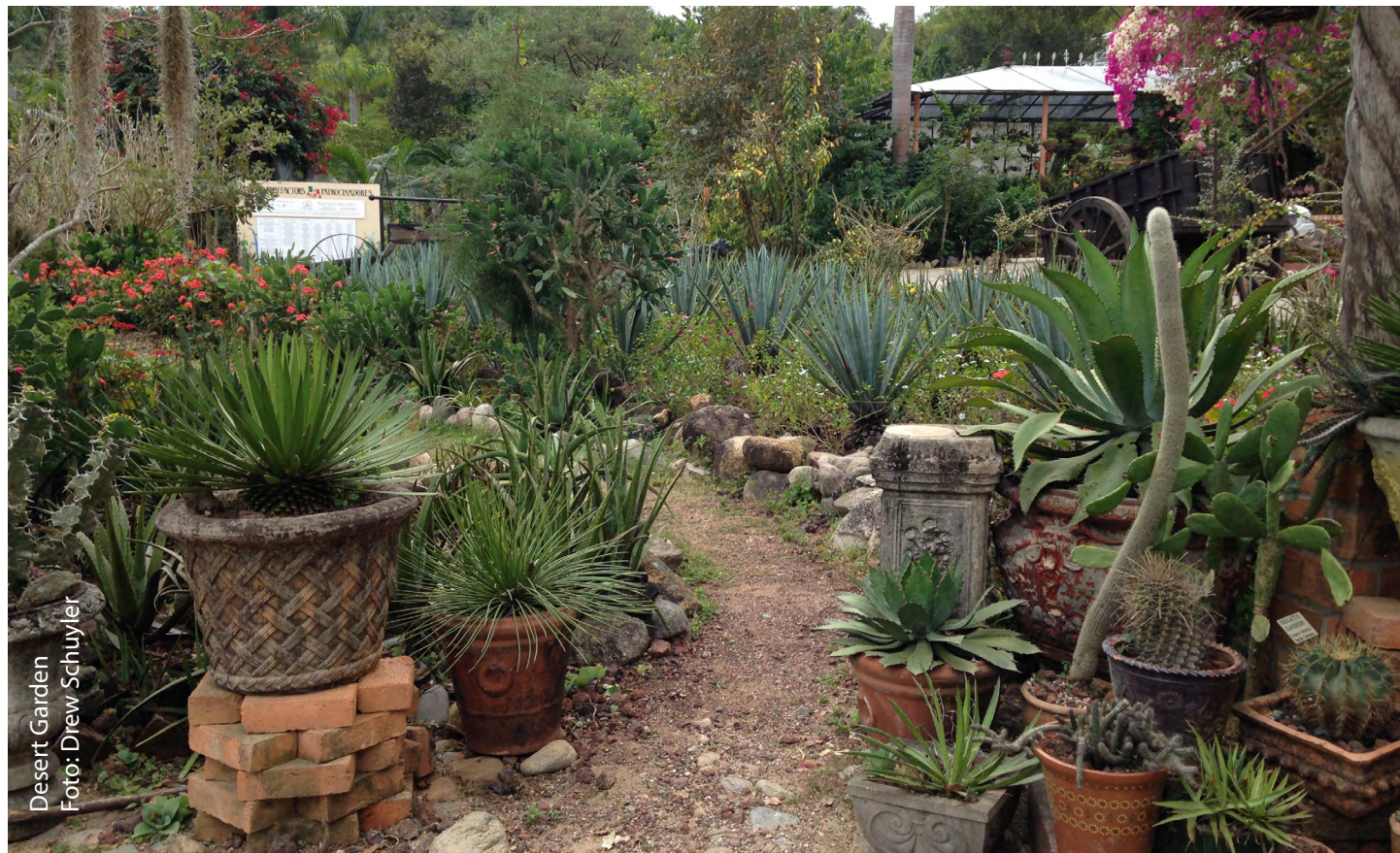
Desert Garden

Dividir tus aportaciones al Jardín Botánico de Vallarta en pagos mensuales puede beneficiar tu presupuesto de donación anual y nos permite la confianza de un ingreso mensual para la temporada baja del año. La nueva página para Compartir Cada Mes (Give Every Month) GEM está disponible en www.vbgardens.org para iniciar este tipo de contribuciones.