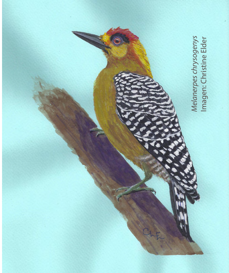
Melanerpes chrysogenys Imagen: Christine Elder

El taller del sábado estará enfocado al dibujo pájaros carpintero, como el Carpintero Enmascarado y el Carpintero Pico Plata; el taller del domingo estará enfocado al dibujo de colibríes – tan rápidos y hermosos. La participación está incluida con la entrada al Jardín. Solicitamos la llegada puntual e, incluso, previa a la hora; también pedimos traer lápices, papel y portapapeles de ser posible. No es necesario el pre-registro, pero te agradecemos la atención de enviar un correo electrónico para calcular el número de artistas con que contaremos: eventos@vbgardens.org .