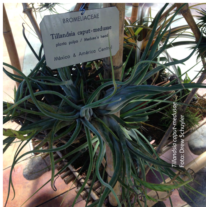
Tillandsia caput-medusae