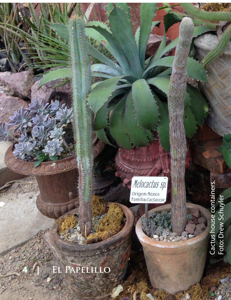
Melocactus sp. Origen: México Familia: Cactaceae

El grupo está interesado en tu opinión. Tú representas a nuestra comunidad y tu voz importa. Por favor comparte lo que piensas sobre las plantas, la ciencia, la conservación y las colecciones. Escribe a educadorambiental@vbgardens.org .