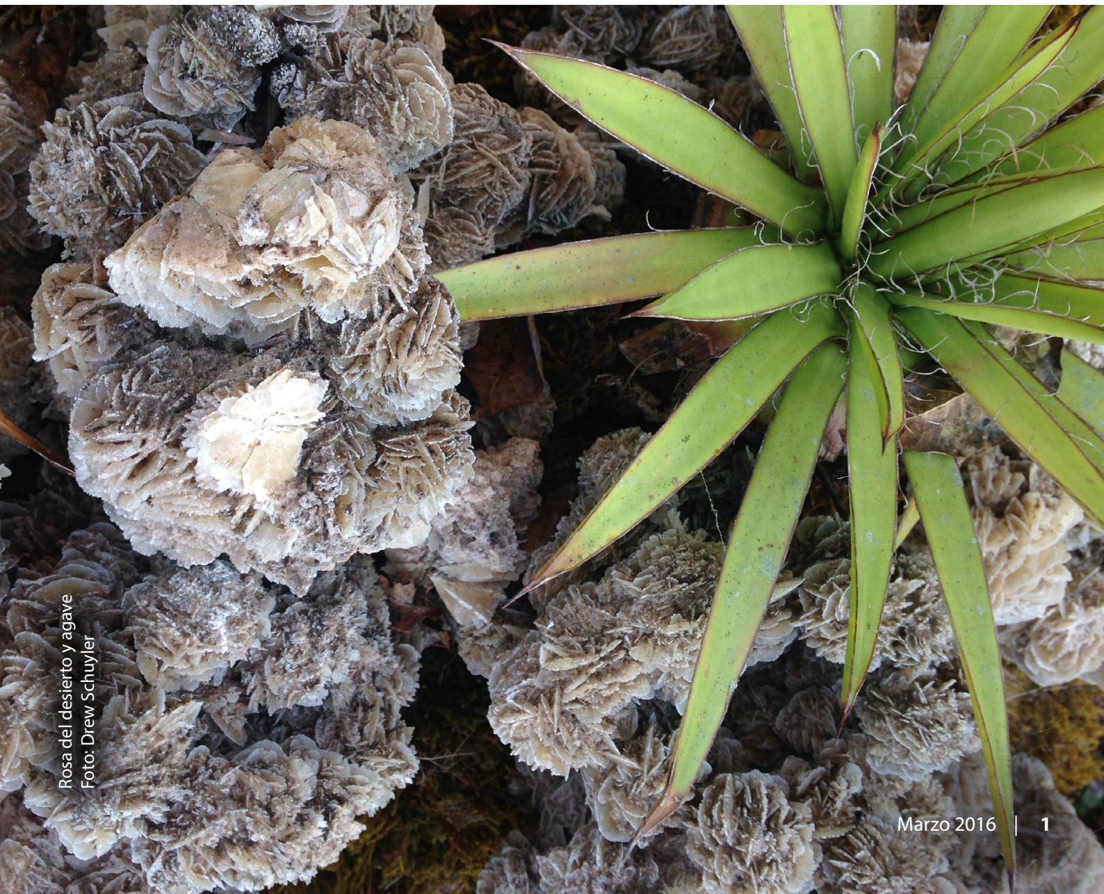
Rosa del desierto y agave