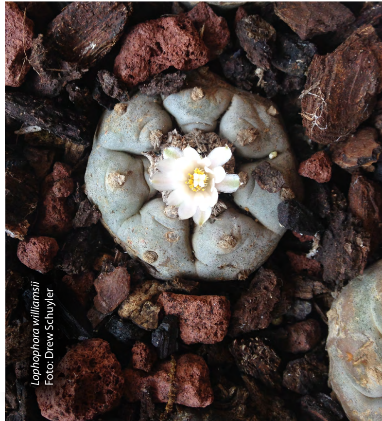
Lophophora williamsii