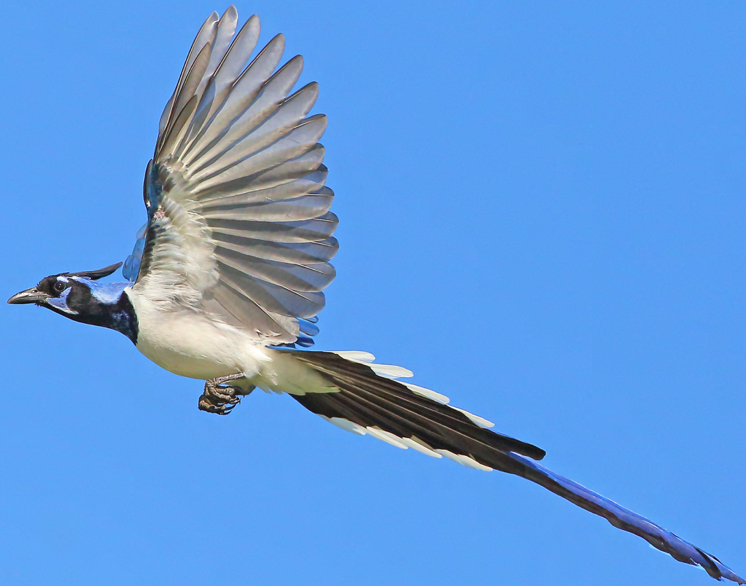
Calocitta colliei