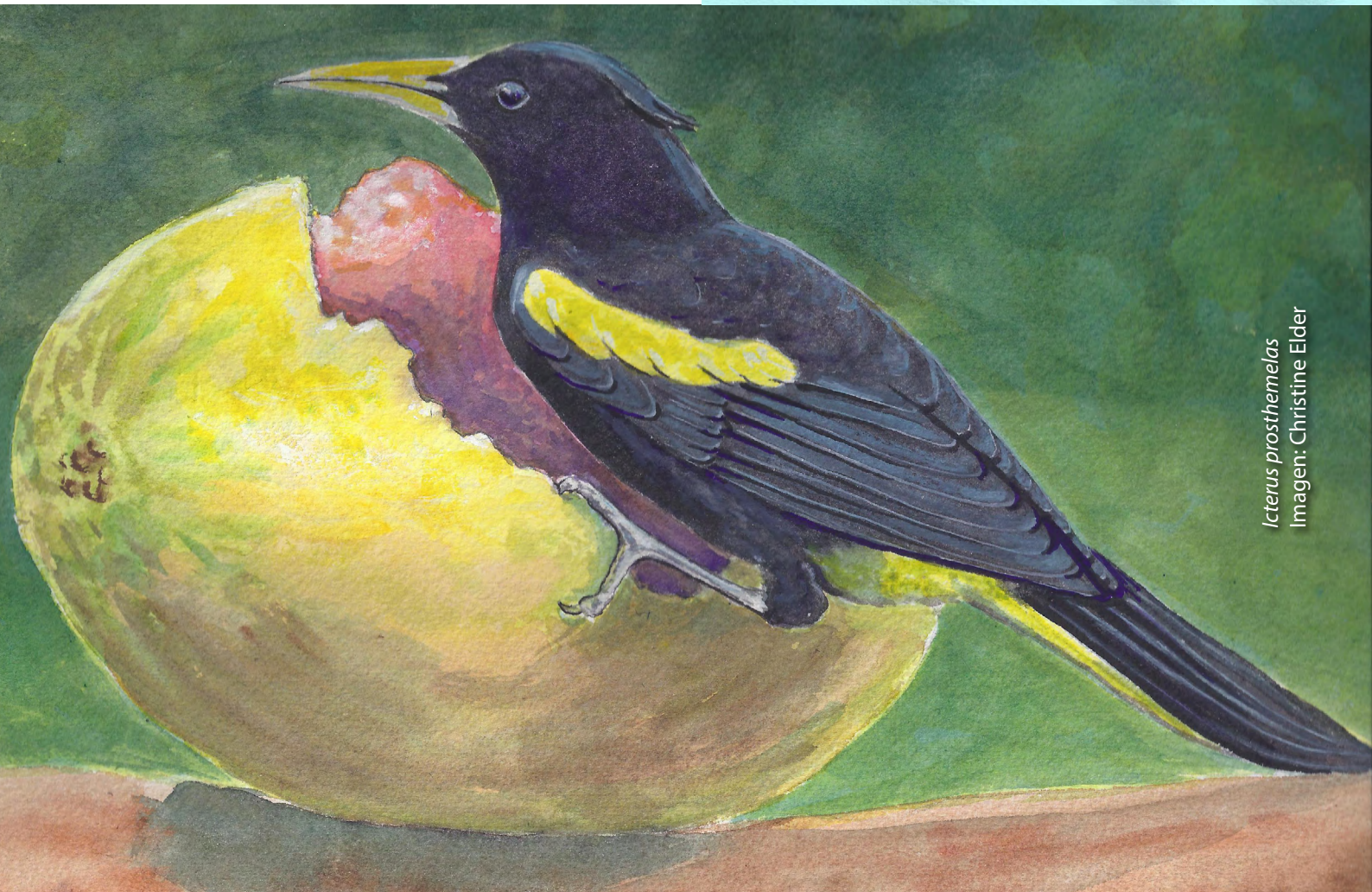
Icterus prothemelas