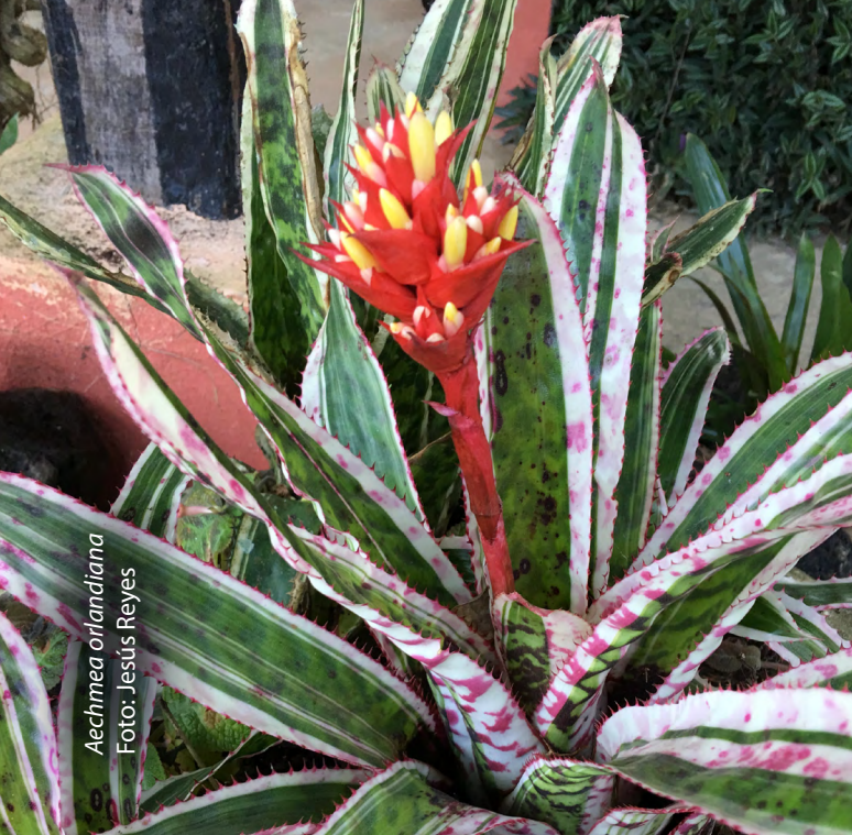
Aechmea orlandiana