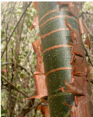
Portada: Jesús Reyes Bursera simaruba