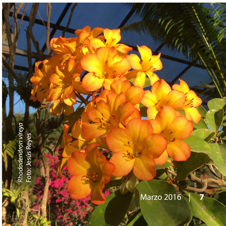
Rhododendron vireya