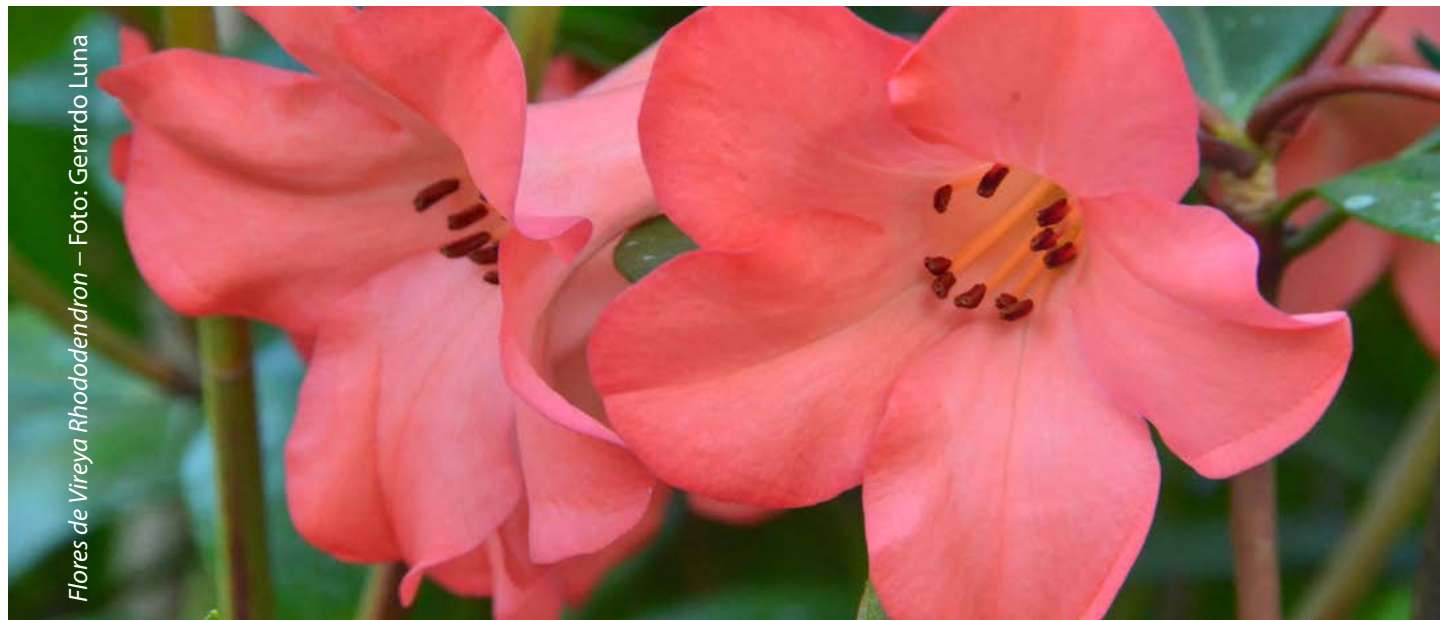
Flores de Vireya Rhododendron

Esta visita generó una intensa curiosidad botánica en los estudiantes de Corazón de Niña, quienes se fueron con muchas ganas de regresar en agosto durante la celebración del cacao y la vainilla para aprender más sobre algunas plantas nativas que ahora esperan cultivar en casa una vez que hayan realizado su proyecto “Corazón Verde”, el cual incluirá la creación de un jardín orgánico en el techo de su casa. Este proyecto les dará ingredientes frescos y decorarán sus platos y mesas con frutas, verduras y flores ¡hechas en casa! El cacao y la vainilla son solamente dos de las muchas posibilidades para cultivar en su casa, especialmente una vez que comiencen a usar su techo como campo de cultivo. En el JBV queremos apoyar a estos futuros horticultores con el diseño y la creación de este espacio verde que, sin duda, les proporcionará una gran conexión con la naturaleza, misma que solamente se origina a través del proceso de cultivar tus propias plantas.