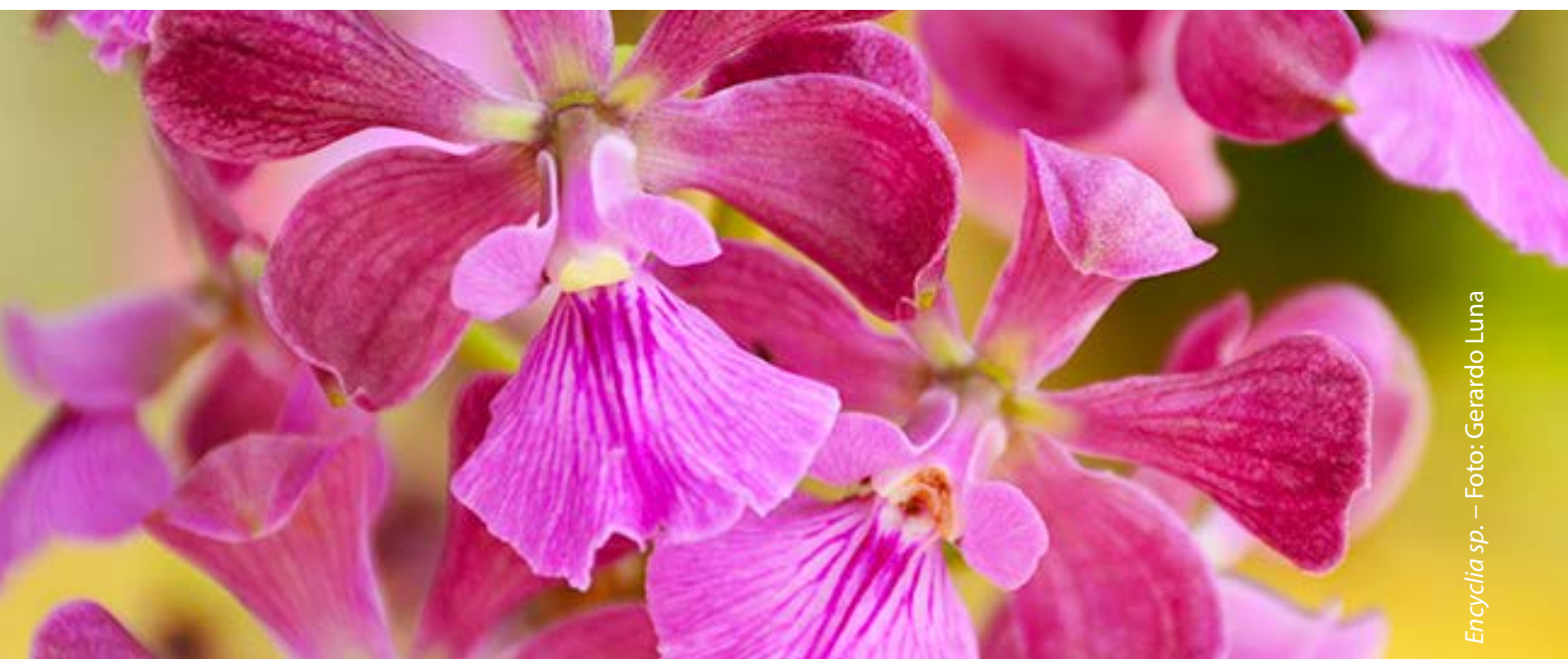
Encyclia sp.

*Algunas actividades están sujetas a cambio. El calendario más actualizado vinculado con links con información de futuros eventos, puede verlo en www.vbgardens.org/calendar .