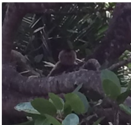
Candid camera-phone monkey snapshot

Por Neil Gerlowski, Director Ejecutivo, JBV