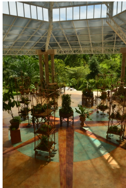
Interior del Conservatorio Vallartense de Orquídeas Mexicanas en la fecha de la terminación de su construcción y, en octubre, ya con algunas exhibiciones de plantas.