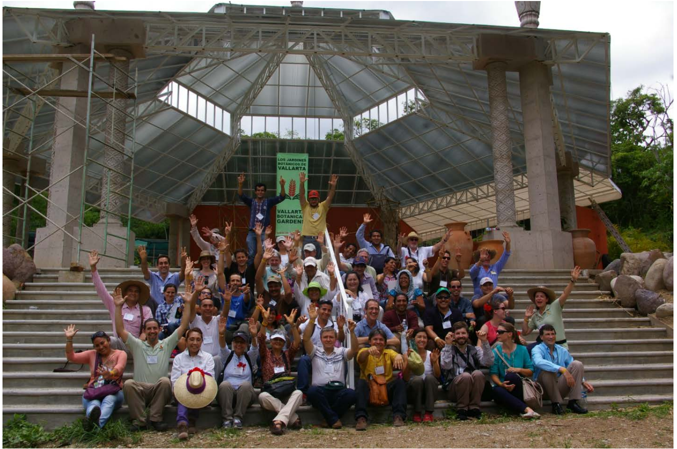
Fotografía grupal de los participantes del primer taller impartido por el Taller de las Américas, Organizado por el Jardín Botánico de Vallarta y La Red de Vigilancia de Plantas Haga click aquí para ver los nombres de los participantes.

El hermoso escenario del Jardín Botánico de Vallarta fue el lugar perfecto para nuestra taller. Nos paseamos por las instalaciones y encontramos varios ejemplos de biodiversidad y especies de plantas compartidas entre jardines de EEUU y México, apoyando los intereses comunes en protegerlas. ¡No se pierdan las plantas y el nuevo Conservatorio de Orquídeas!