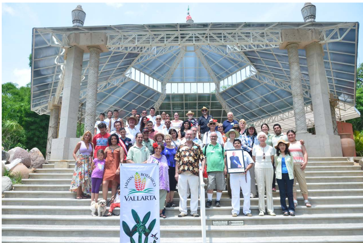
Dedicatoria de las escalinatas del Conservatorio Vallartense de Orquídeas Mexicanas