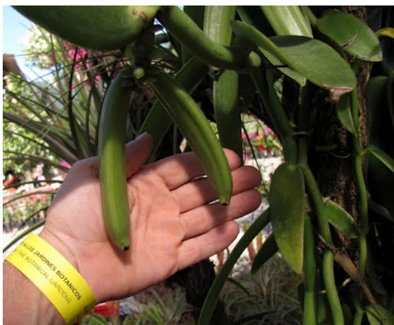
“Vainas” de Vainilla en el Jardín Botánico de Vallarta

La culinaria vainilla ( Vanilla planifolia ) fue cultivada por primera vez por el pueblo Totonaca en la costa del Golfo de México, en lo que actualmente es el estado de Veracruz. De acuerdo a la mitología de este pueblo, la orquídea de vainilla surgió de una historia de amor y tragedia. Cuando la princesa Xanath huyó al bosque con su amante, ya que su padre no aprobaba que se casara con un mortal, ambos fueron capturados y decapitados. Un árbol creció justo en el lugar donde la sangre del amante de la princesa tocó el piso, y, a un lado, donde la sangre de la princesa tocó el suelo, creció una enredadera de vainilla que quedó atada al árbol para siempre. México tuvo en sus manos el monopolio de la vainilla hasta 1841, cuando un niño esclavo de doce años, que vivía en la isla francesa de Bourbon (ahora llamada Réunion), descubrió una manera sencilla de polinizar la flor de forma manual. Debido al trabajo que se requiere para polinizar y curar la vainilla, ésta es la segunda especia más cara después del azafrán. Para aprender más acerca de esta increíble planta, visita muy pronto el Jardín Botánico de Vallarta.