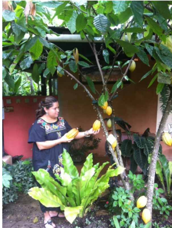
Árboles de Cacao en el Jardín Botánico de Vallarta

El chocolate es un producto del cacao ( Theobroma cacao ), un pequeño árbol perennifolio que es originario del sur de México. Sus semillas se utilizan para elaborar cacao en polvo y chocolate. Su fruto, comúnmente llamado “mazorca”, tiene forma ovoide; mide de 15 a 30 cm de largo y de 8 a 10 cm de ancho; el color que indica su maduración es un amarillo-anaranjado; llega a pesar aprox. 500 g cuando madura. La mazorca contiene de 20 a 60 semillas, que vulgarmente se conocen como “habas” o “granos” de cacao, incrustadas en una masa de pulpa blanca. Las semillas son el principal ingrediente del chocolate, mientras que la pulpa se utiliza en algunos países para preparar un jugo refrescante. La sustancia química más destacada que lo compone es la teobromina, un compuesto estimulante que es muy similar a la cafeína.