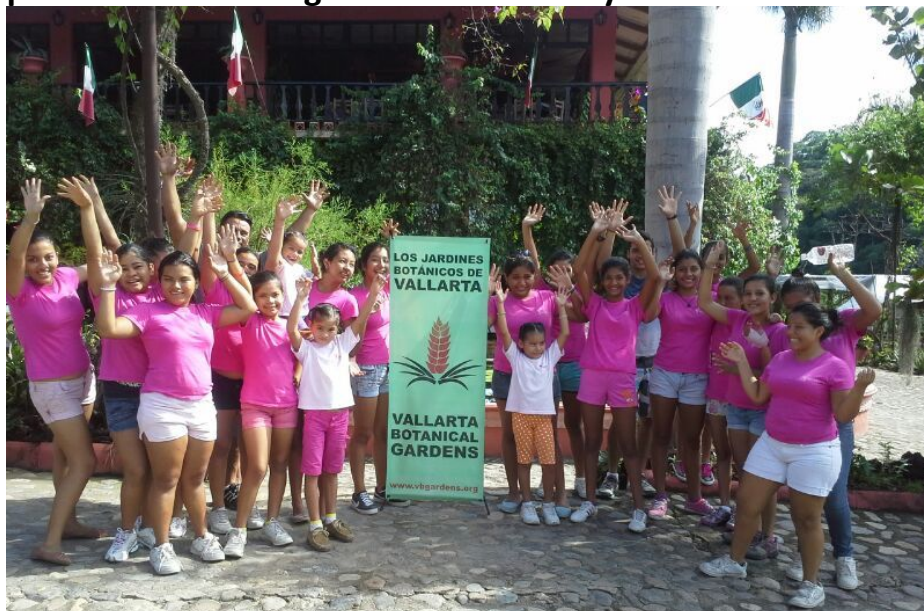
Niños visitantes de la Casa Hogar Corazón de Niña